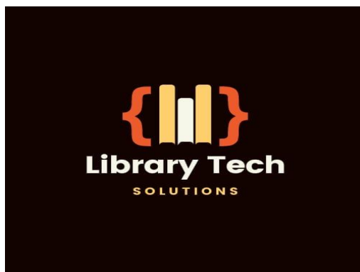
Figura 2 - Logo do Projeto