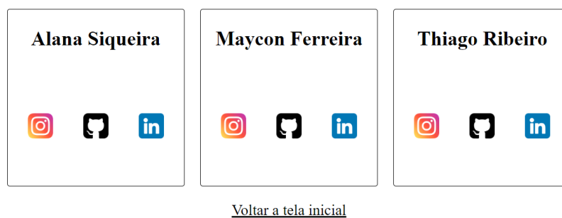
Figura 14 - Tela de Contatos

Entre em contato com os desenvolvedores!