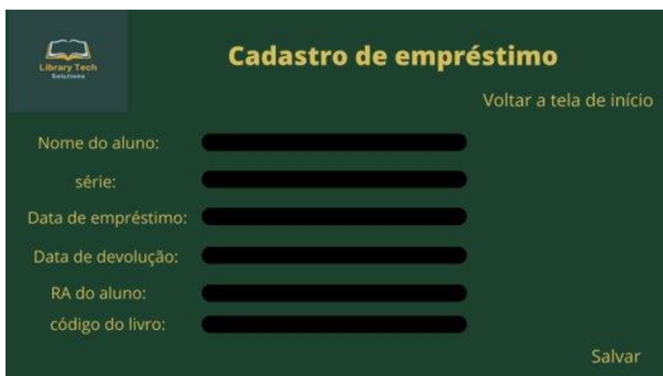
Figura 4 - Wireframe da Tela cadastro