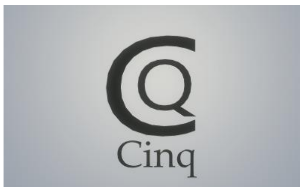
Figura 1 - Logo da Equipe