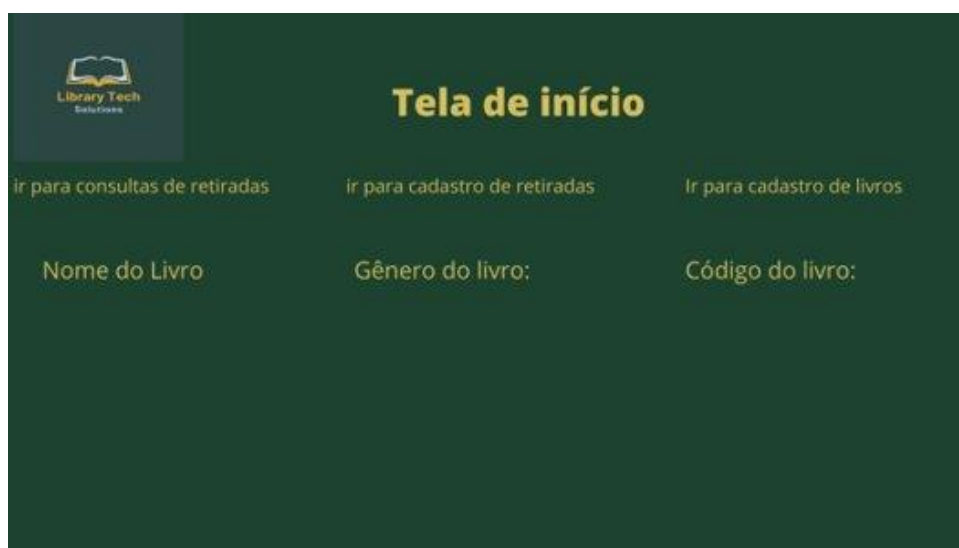
Figura 3 - Wireframe da Tela Início