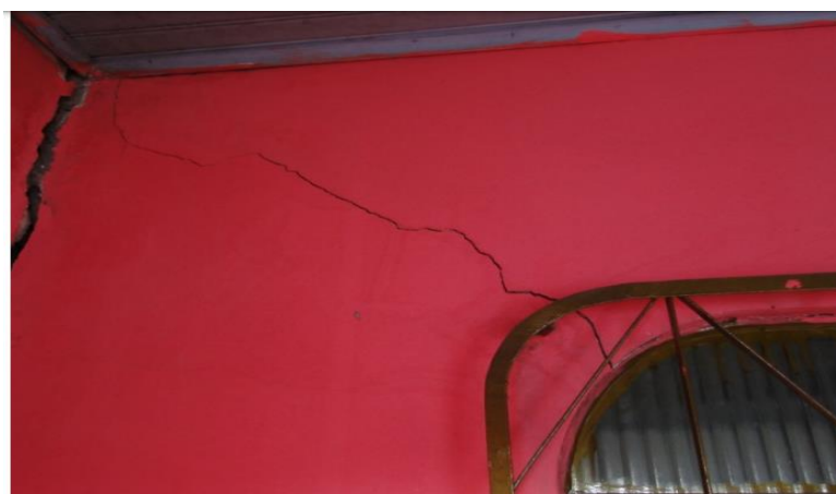
Figura 15. Fissuras verticais

Fissuras verticais partindo de abertura, localizada no centro da edificação, conforme as figuras Figura 15 - 18.