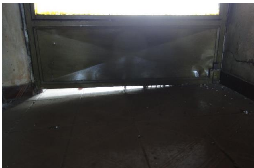
Figura 22. Fissuras verticais internas

Além de fissuras pode se observar na parte interna da edificação o desalinhamento do foro de madeira, causando aberturas nas suas partes limitantes com as paredes, também é visível o desaprumo de paredes e piso, identificado pelo não fechamento de porta e janelas e fendas causadas nestas.