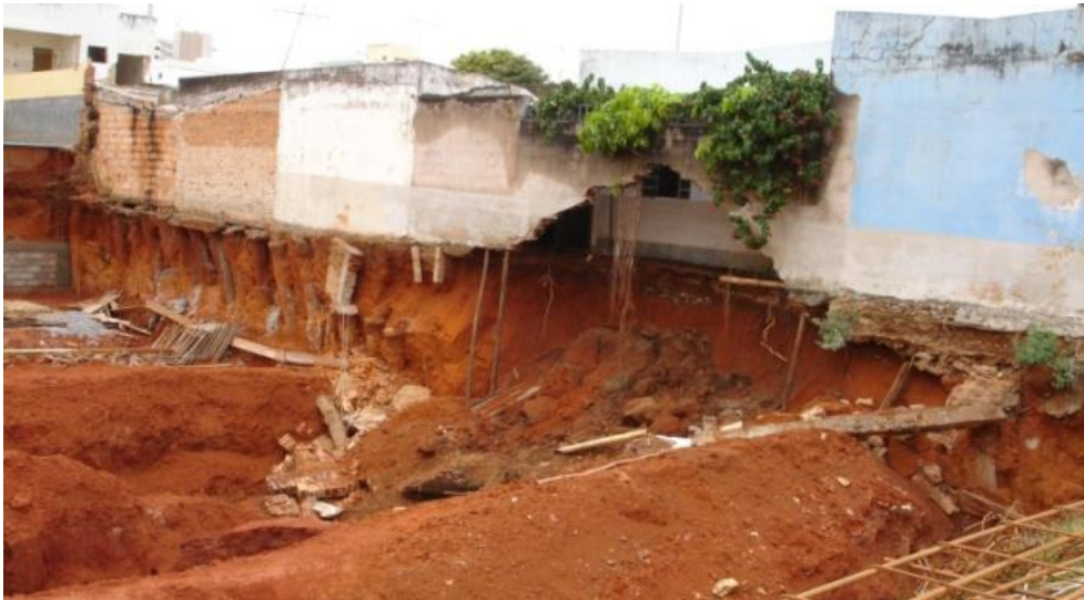
Figura 9. Detectada a movimentação estrutural, durante período de intensidade pluviométrica.