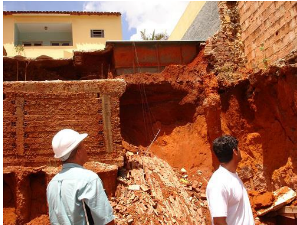
Figura 6. Vista do fundo do lote da QSA11 lote 15/16, instabilidade do talude e rompimento da cortina (contenção existente), visual de patologias na obra vizinha.

também foi verificado que algumas peças de vidro sofreram trincas, indicando possíveis movimentações da estrutura.