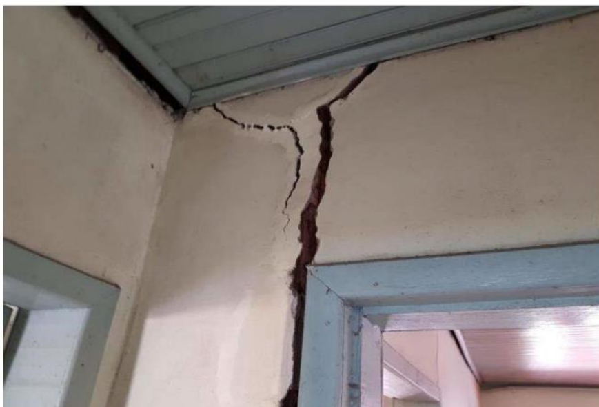
Figura 21. Fissuras verticais internas