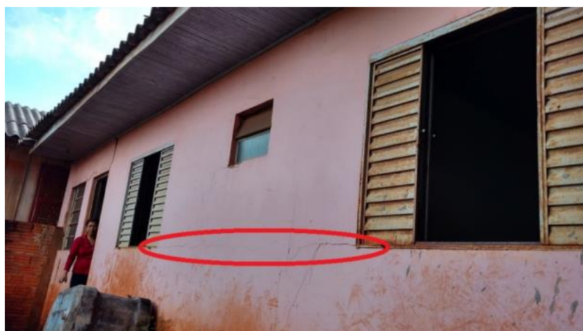
Figura 17. Fissuras horizontais