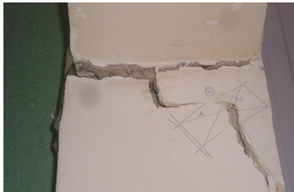
Figura 7. Medição de fissuras por meio do retângulo de medição.