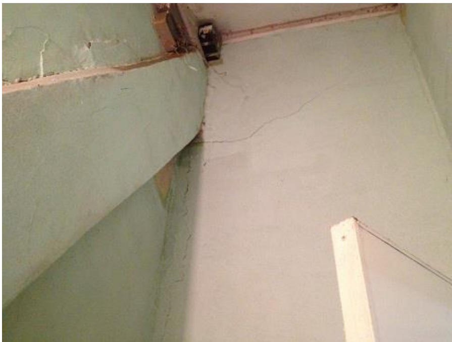
Figura 12. Trincas em alvenarias e vigas do prédio comercial.