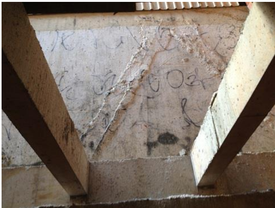
Figura 14. Reforço da estrutura para conter estrutura do prédio vizinho, a mesma edificação que foi acrescida de dois pavimentos após o seu término.