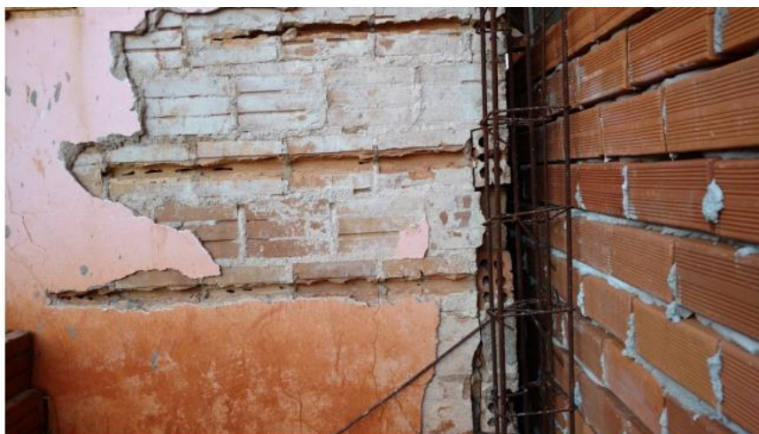
Figura 18. Desplacamento