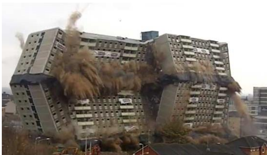
Figura 2. Prédio de 17 andares é implodido na Escócia