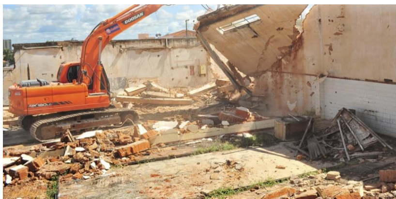
Figura 1. Demolição com o uso de equipamento mecânico.