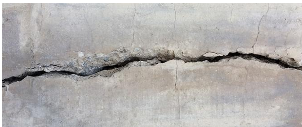
Figura 3. Indicado para locais onde não é possível usar explosivos