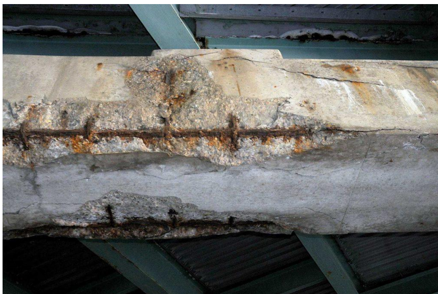
Figura 4. A carbonatação do concreto é um processo físico-químico entre CO 2 e os compostos da pasta de cimento.