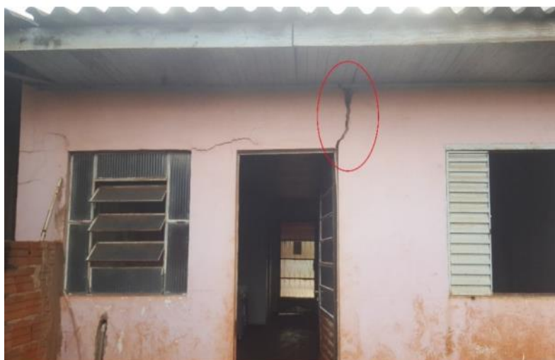
Figura 16. Fissuras verticais