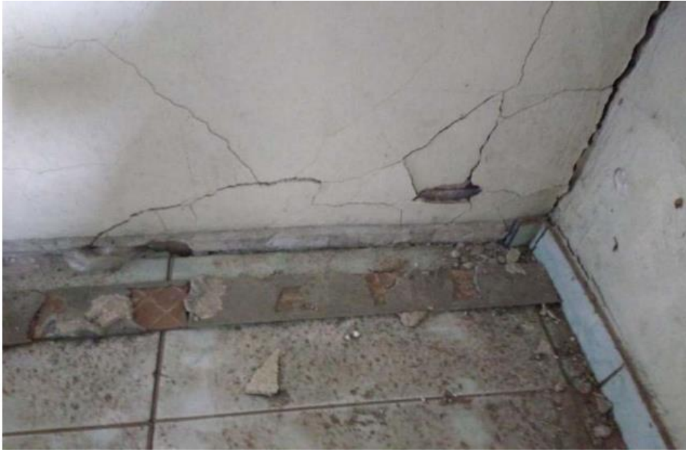
Figura 19. Deslocamento

Na parte interna da residência foram encontrados os deslocamentos do reboco nos quartos com paredes que fazem divisa com a edificação causadora dos problemas, ainda nestes quartos foi observado o deslocamento do piso cerâmico conforme a Figura 19. No interior da residência foram encontradas fissuras com maior abertura conforme as figuras 21 a 22