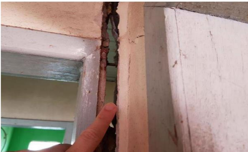
Figura 20. Fissuras verticais internas