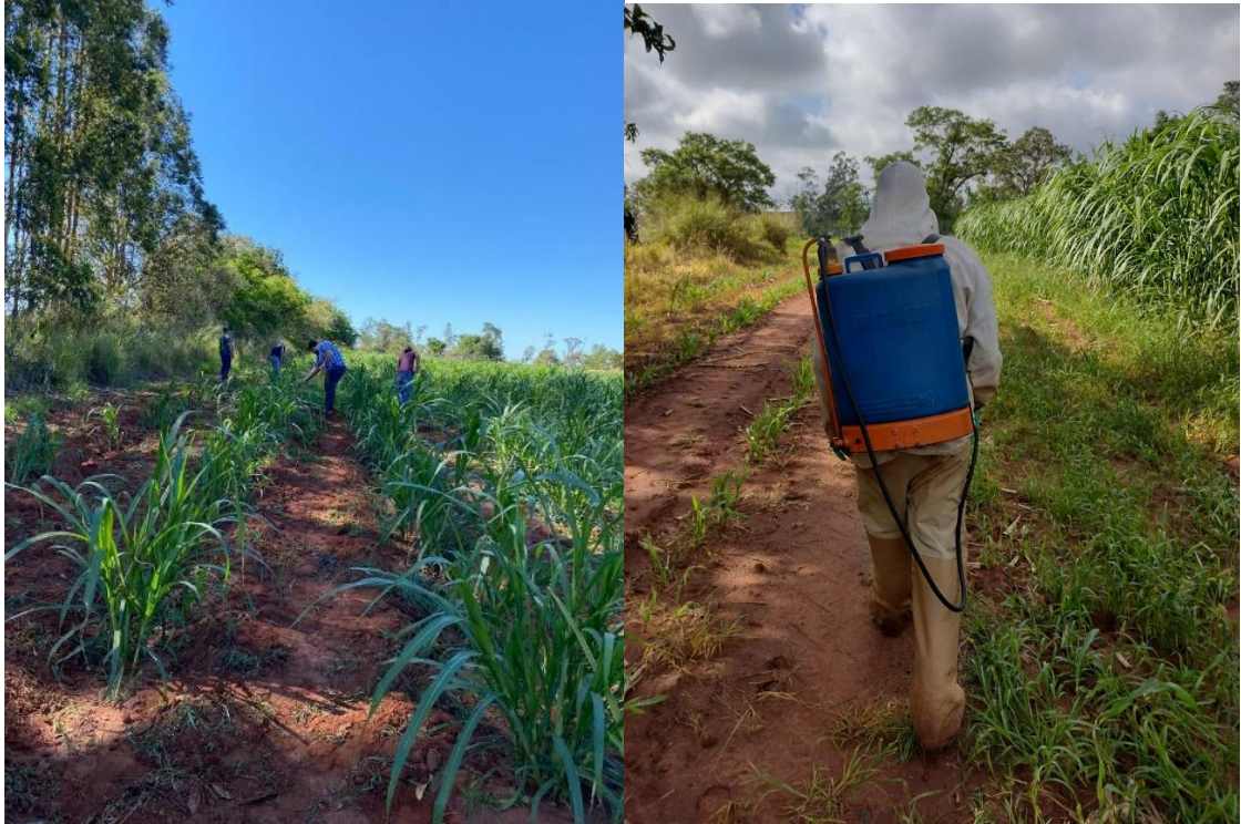
Figura 12 - Controle de plantas de ervas-daninhas e pragas