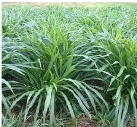
Figura 5– BRS Kurumi

BRS Kurumi ( Pennisetum purpureum Schum ). A BRS Kurumi foi obtida pela seleção e clonagem de uma das plantas de porte baixo desta progênie., é adaptada a maior parte das regiões brasileiras. a BRS Kurumi caracteriza-se pela elevada proporção de folhas e pequenos alongamento de colmo. Podendo chegar 0,7 a 0,8 metros.