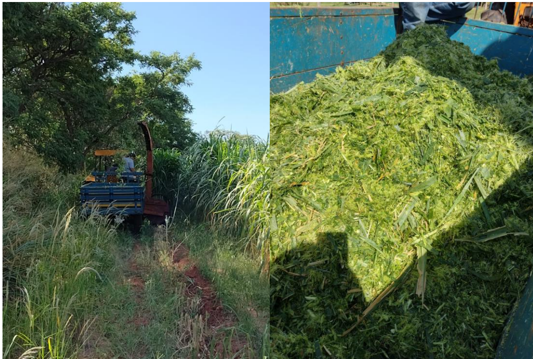
Figura 14 - Colheita do capim

O capim foi colhido com a ensiladeira, depois disso foi repicando com o facão beirando o chão para o rebrotamento, a colheita da forragem pode ser realizada de forma manual ou mecanizada. A opção pela forma manual de colheita aumenta os custos de produção, quando comparada à colheita mecanizada. No caso da colheita mecanizada, o espaçamento entrelinhas deve ser de no mínimo 1,00m, visando evitar que as rodas das máquinas passem sobre as linhas de capiaçu, comprometendo a rebrota pós-corte.