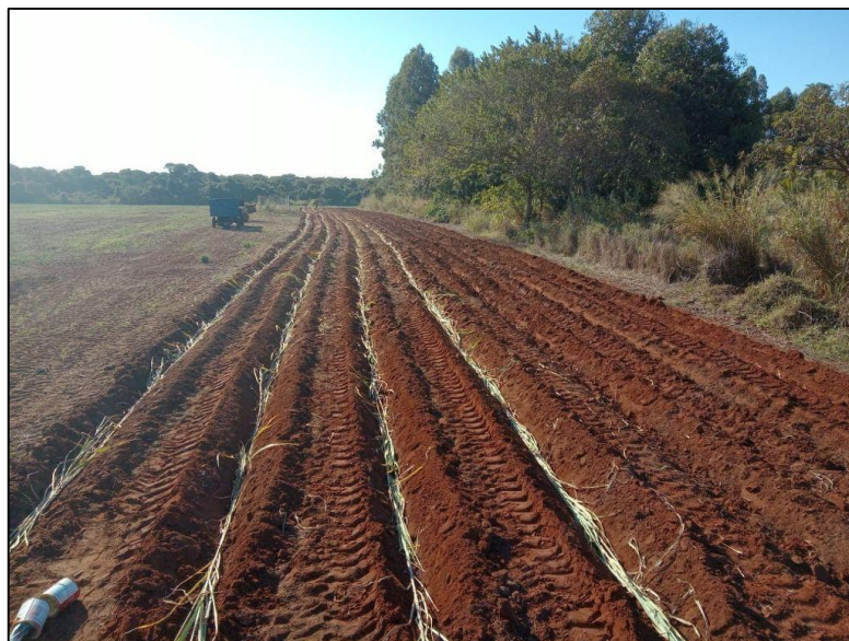
Figura 13 - Área de plantio

Para a preparação do solo para o plantio foi introduzido primeiro o sucador para facilitar a aplicação do fósforo (P), em seguida fizemos o plantio do capim de forma direta (ponta com pé).