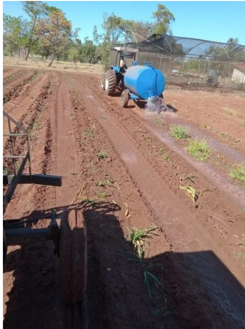
Figura- 7 irrigação