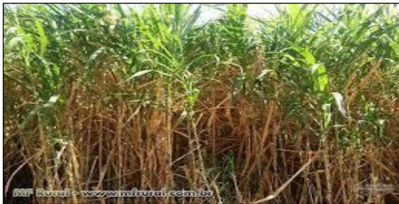
Figura 4– Capim Cameron

O capim Cameron ( Pennisetum purpureum Schum var Cameroon ) é uma grama tropical perene nativa da África rural. É uma gramínea com importante valor forrageiro. Apresenta as características morfológicas de ser alto, ereto, agrupado e largo e longo nas folhas. É uma espécie com alta eficiência fotossintética, possui forte capacidade de acumulação de matéria seca e pode ser utilizada para pesquisas de produção de energia. Podendo atingir uma altura de 3 a 4 metros.