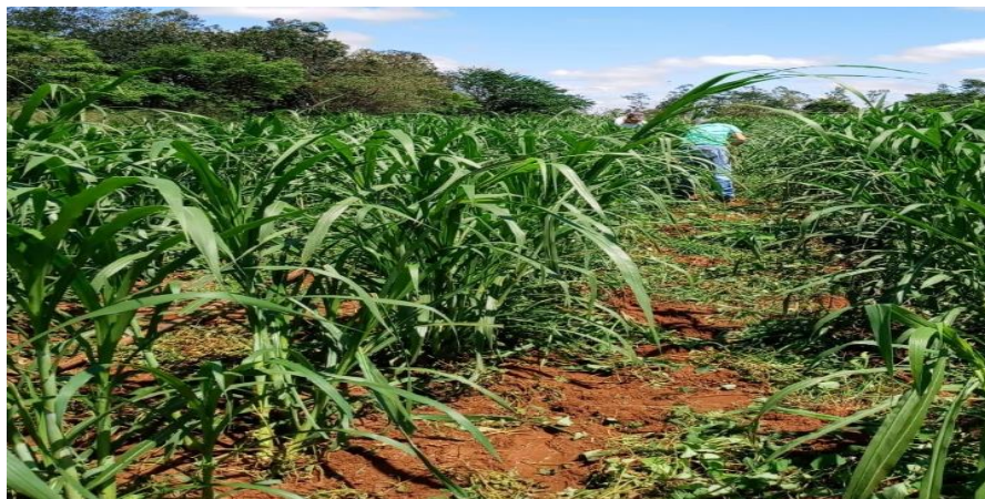
Figura 1- Capiaçú

As folhas de capiaçu são suplementadas em grandes quantidades na forma de silagem ou de verduras picadas, com alto rendimento. Devido ao seu alto potencial de produção (50 toneladas / ha / ano), também pode ser utilizado para a produção de biomassa energética. Esse benefício da Campineira parece ser uma alternativa de maior rendimento à silagem e à carne picada verde, ajudando os produtores de leite e carne a reduzir custos sem comprometer a qualidade.