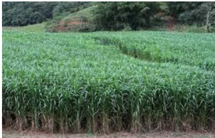
Figura 2 – Capiaçu

O capiaçu ( Pennisetum purpureum Schum ) foi desenvolvida através de um plano de melhoramento e, portanto, apresenta algumas vantagens em termos de produtividade e nutrição. Algumas características desta raça são: desenvolve-se bem neste tipo de ambiente e é recomendado para o bioma Mata Atlântica. Possui boa tolerância quando submetido à pressão da água. Podendo chegar até 5 metros. As folhas são largas e compridas. Excelente valor nutricional e capacidade Antitombamento. Fácil de mecanizar a colheita porque fica em pé. Produz silagem de alta qualidade para gado e pequenos ruminantes.