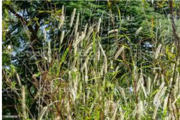
Figura 6 – Capim Napier

O capim Napier elefante ( Pennisetum purpureum ) têm caules grossos, folhas largas, floração média (abril a maio) e cachos abertos. Possui boa produtividade na região sudeste do país. É uma boa escolha para vacas em lactação. Mas deve chegar a 15% de proteína bruta. O corte deve ser observado entre 28 e 35 dias. Tem porte alto até 4,20 metros de altura.