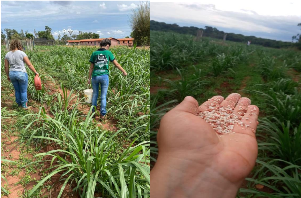
Figura 8 - Adubação