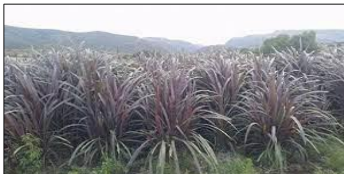
Figura 3– Capim elefante roxo

O capim Elefante Roxo ( Pennisetum purpureum Schum Graminea ) é nativo da África. Tem um ciclo de nutrientes perene, raízes agrupadas, altas, eretas e agrupadas. Sua altura é de 3 a 4 m, até 6 metros de altura. Muito utilizado como grama picada para "in natural" e silagem.