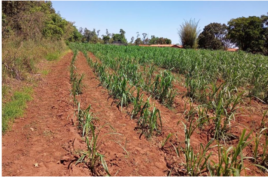
Figura 11 - Local e período