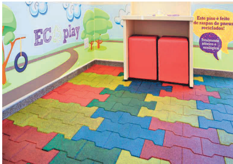
Figura 5: Ecoplay - Espaço Kids

Espaços como este, despertam a curiosidade e interesse de adultos e crianças que aprendem a importância do descarte correto dos pneus. Além de um ambiente divertido já começam a entender conceitos como sustentabilidade, preservação do meio ambiente e reaproveitamento de materiais que poderiam ser descartados de qualquer maneira, em qualquer lugar.