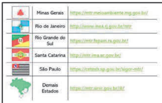
Figura 4: Relação de sites para emissão do MTR no Brasil

A figura 4 mostra a relação dos sites para emissão do MTR em cada Estado.