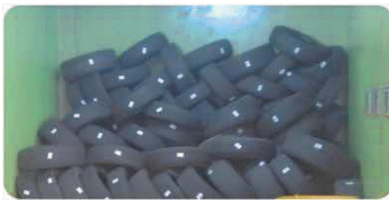
Figura 3: Armazenamento de pneus

No que se refere aos pneus para descarte, os mesmos são acomodados de maneira entrelaçada e devidamente etiquetados com uma etiqueta com código de barras por meio de um processo iniciado no momento em que o cliente decide deixar o pneu na loja. Com esta etiqueta é possível acompanhar onde este pneu foi destinado pelo parceiro logístico homologado para coleta de resíduos. A figura 3 mostra os pneus de descartes etiquetados e acomodados.