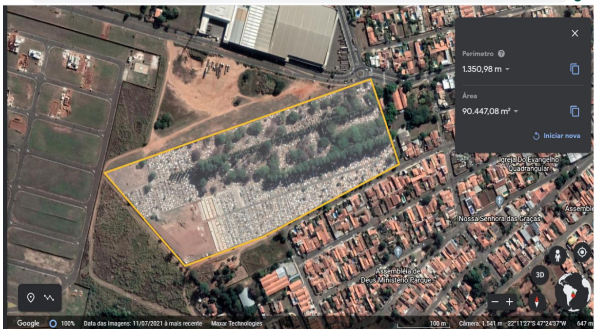
Imagem: Cemitério de Leme (Google Earth)

O cemitério São João Batista, foi inaugurado no ano de 1911, abrangendo uma área de aproximadamente 90.447 m 2 .