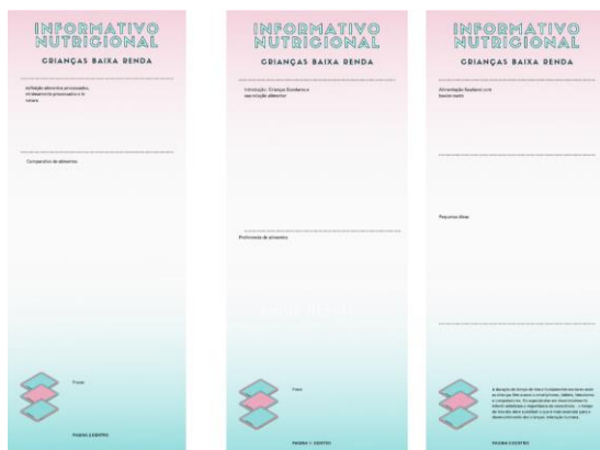
Figura 2 - Protótipo da Cartilha

Esse informativo vem como um resumo da pesquisa realizada, contendo de forma didática o conteúdo técnico trabalhado nessa. O modelo final completo encontra-se no Apêndice A.