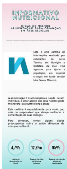
Figura 3 - Modelo final da Cartilha