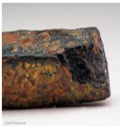
FIGURA 3: Torita

Mineral raro, encontrado em pegmatitos (rochas holocristalinas), que pode ser utilizado em equipamentos eletrônicos e laboratoriais (submetidos a elevada temperatura), produção de combustível nuclear, dentre outras (BRITO, 2019).