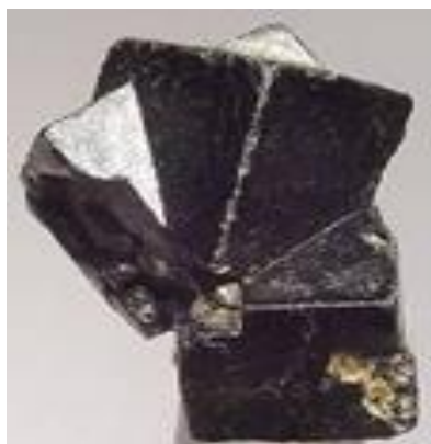
FIGURA 2: Torianita

Torianita (óxido de tório) pode ser utilizado como catalisador na indústria, como combustível em reatores nucleares, e especificadamente na cobertura dos fios de tungstênio em equipamentos eletrônicos (BRITO, 2019).