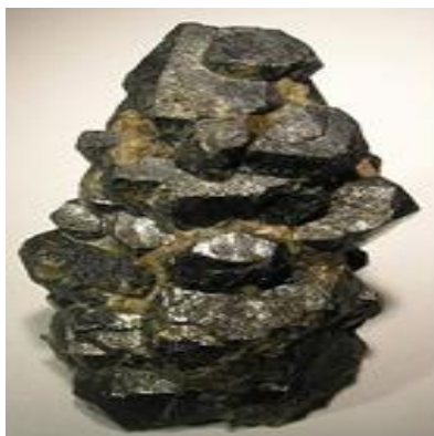
FIGURA 1: Uraninita