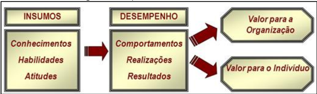
Figura 2: Competências como fonte de valor