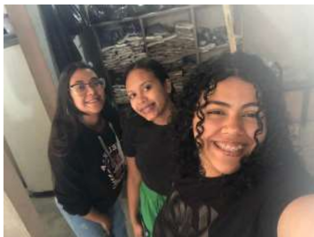
(Levando ideias de implementação)