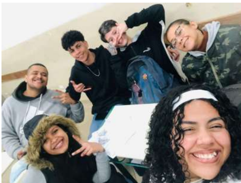
(Brainstorming do grupo)

Levantamos estratégias feitas através de um grande brainstorming, para a melhoria na comunicação interna usando a tecnologia a favor tanto dos colaboradores quanto dos clientes.