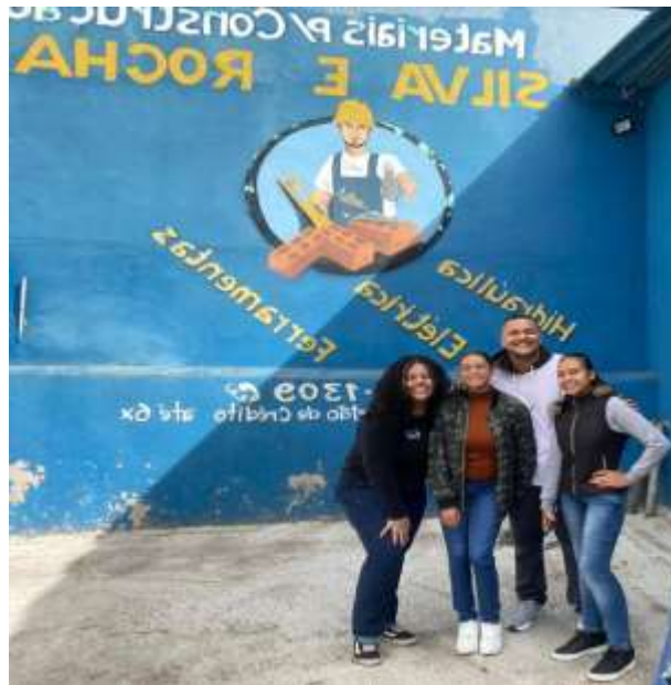
(Entrevista e análise de swot)

Suas ameaças são falta de organização interna e na comunicação com colaboradores. E o grande número de concorrência, podendo impactar a participação da empresa no mercado.