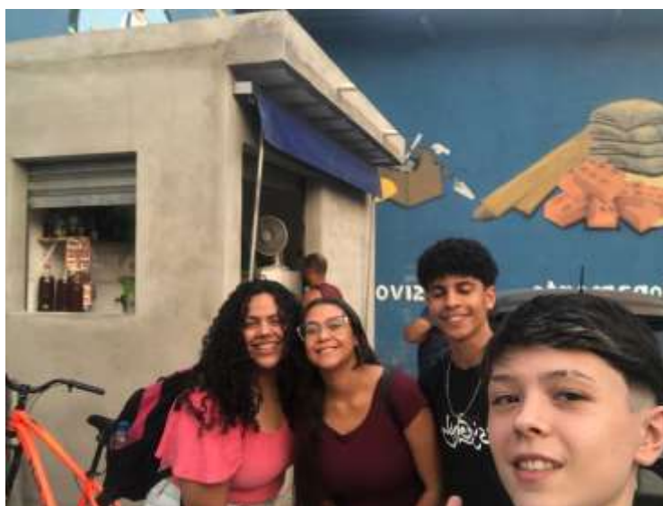
(Quadro de avisos implementado)