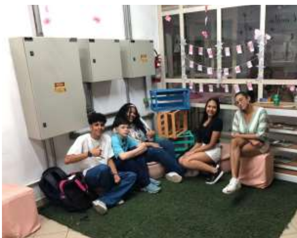
(Mais um brainstorming do grupo)

Foi feita uma reunião para alinhar detalhes sobre o quadro de avisos e espaço de decompressão. Como questões financeiras, qual lugar da empresa colocaria?