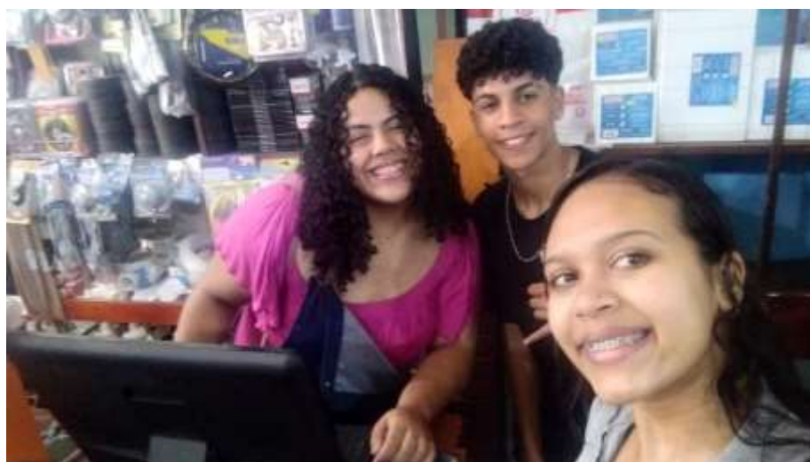
(Implementação do Drive e WhatsApp)

Foi criado um drive com um novo e-mail corporativo, onde os colaboradores possam transferir todas e quaisquer documentos para lá, organizando em pastas para melhor entendimento.