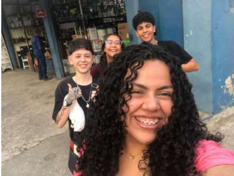
(Felizes com os resultados)