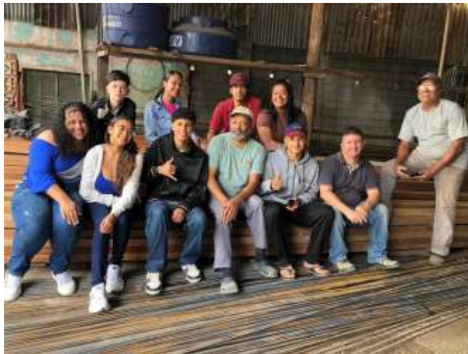
(Comemorando bons resultados)

Onde juntamos todos os colaboradores e fizemos uma pequena comemoração.