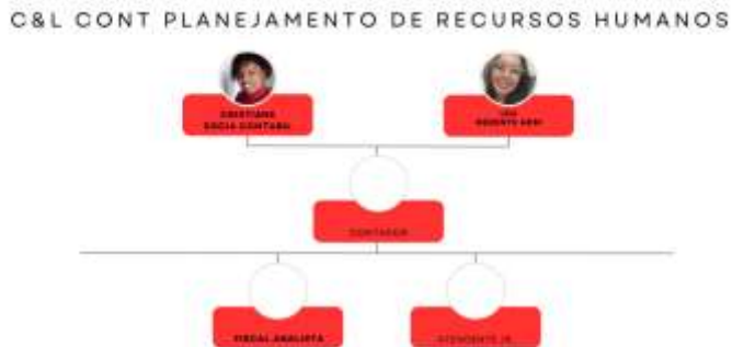
(Figura . Organograma C&L CONT)

E, abaixo poderá analisar a ilustração do Organograma para entender como ocorrerá a hierarquia estabelecida para o desempenho das áreas ativas pelo escritório C&L CONT