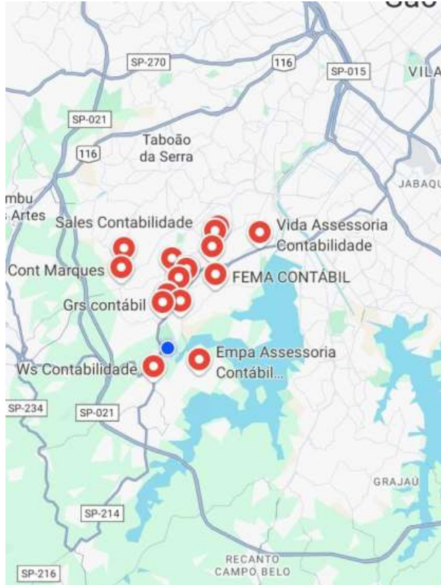
(Figura . Mapa - Escritórios de Contabilidade (Concorrentes Diretos) no Jardim Ângela, São Paulo/ SP.)

A seguir resultado das pesquisas feitas por meio do Google Maps o qual poderá identificar em pontos de localização em vermelho, clientes diretos e indiretos (Figura 3):