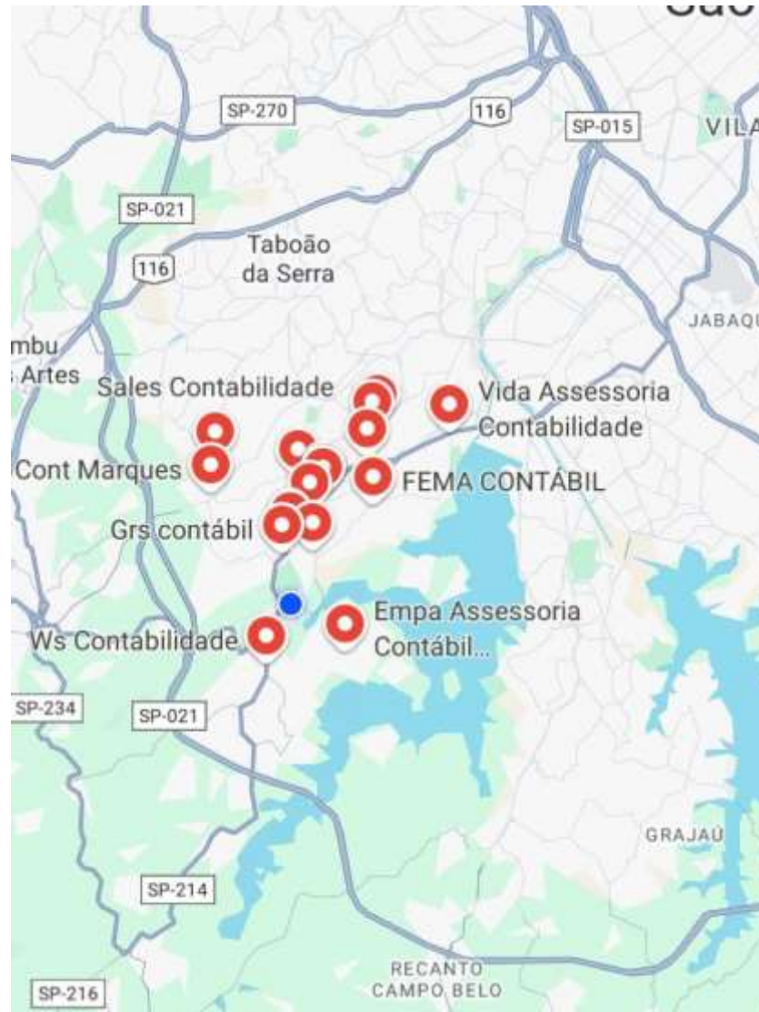
(Figura . Mapa - Escritórios de Contabilidade (Concorrentes Diretos) no Jardim Ângela, São Paulo/ SP.)

A seguir resultado das pesquisas feitas por meio do Google Maps o qual poderá identificar em pontos de localização em vermelho os concorrentes diretos: