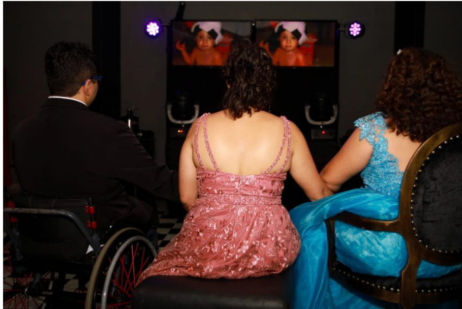
Figura 50. Vídeo com fotos e homenagem dos pais.