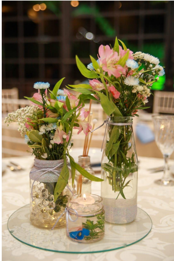
Figura 25. Arranjos das mesas dos convidados.