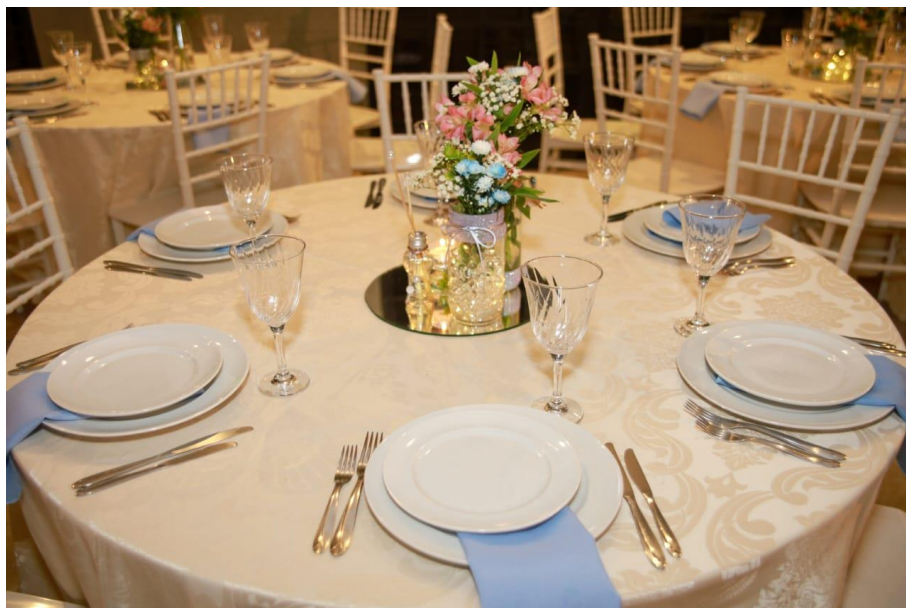
Figura 24. Mesa dos convidados.