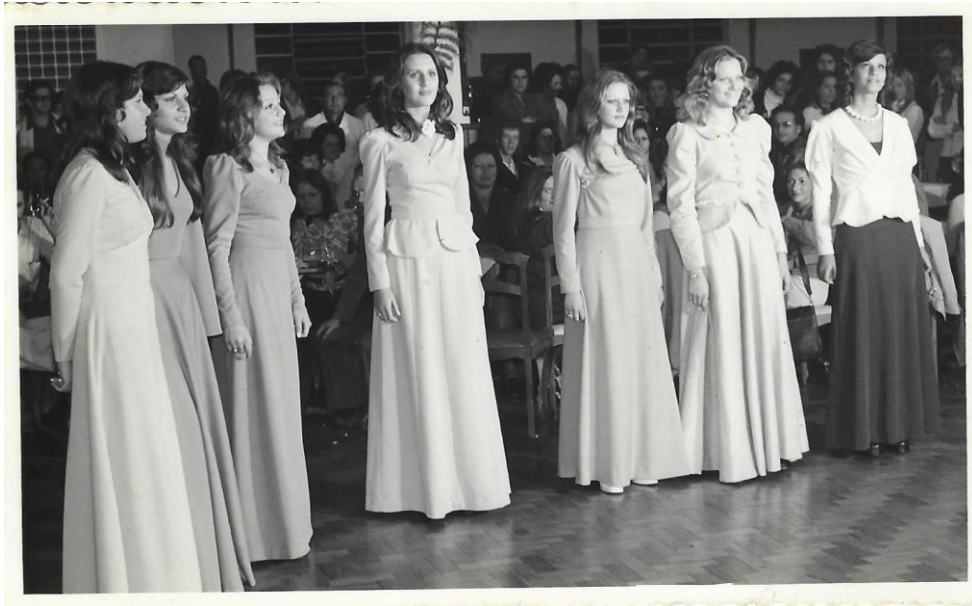
Figura 2. Debutantes do ano de 1963.