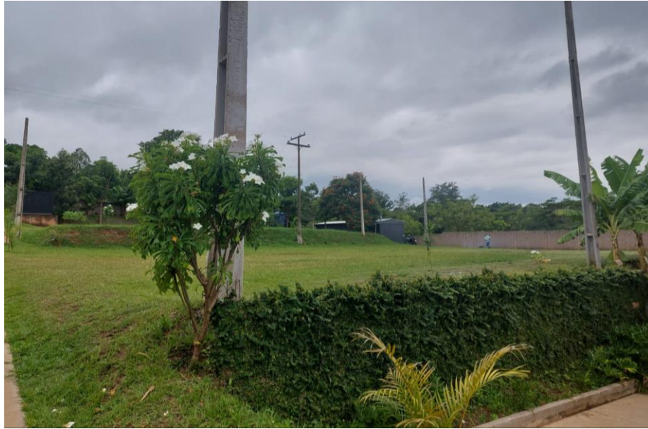
Figura 8. Estacionamento.