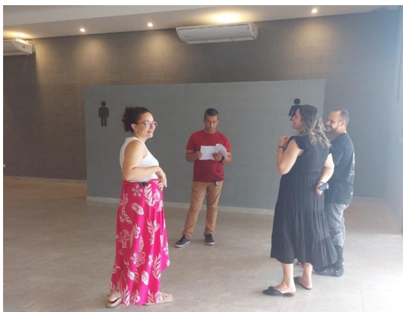
Figura 11. Visita técnica no local do evento com profissionais envolvidos.