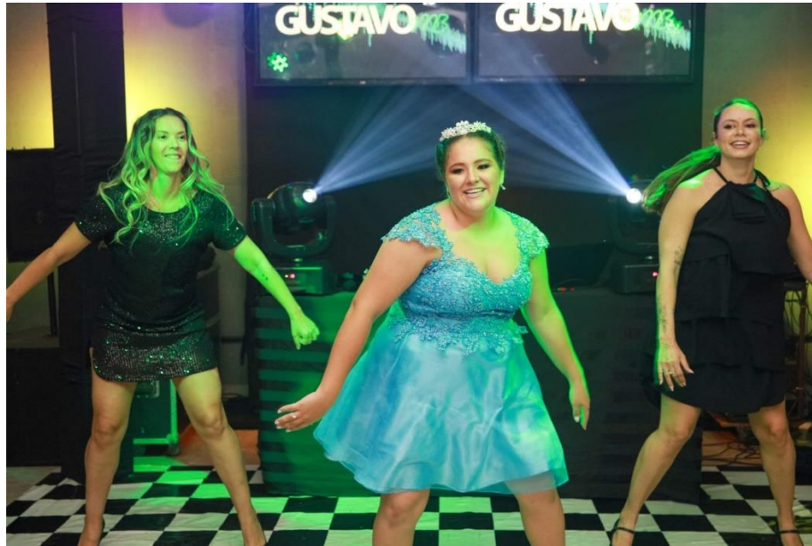
Figura 55. Dança para abertura de pista.

previamente ensaiada com o intuito de chamar os convidados a virem para a pista de dança.