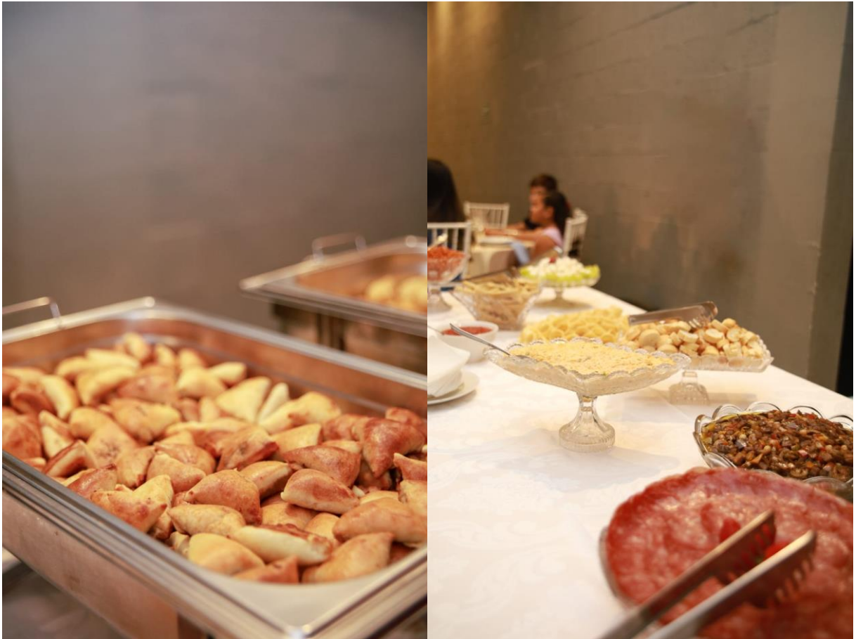
Figuras 30 e 31. Cardápio de entrada servido no aparador.