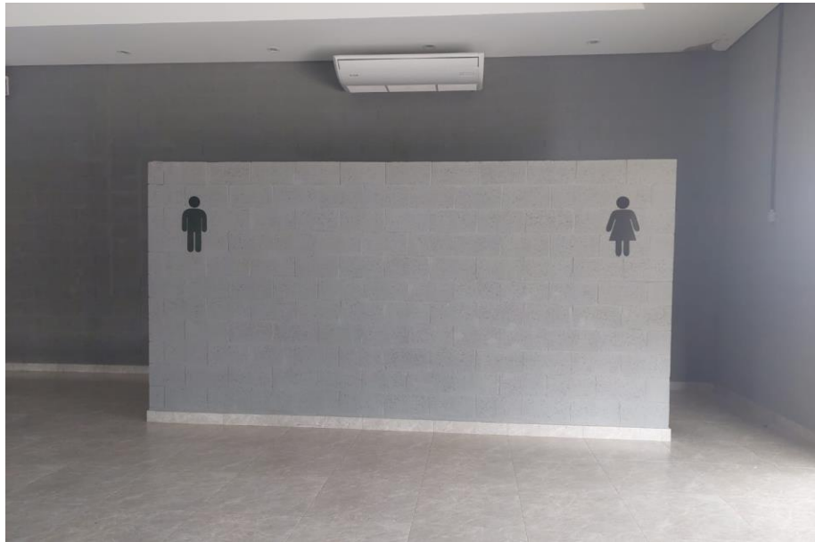
Figura 6. Identificação dos sanitários.