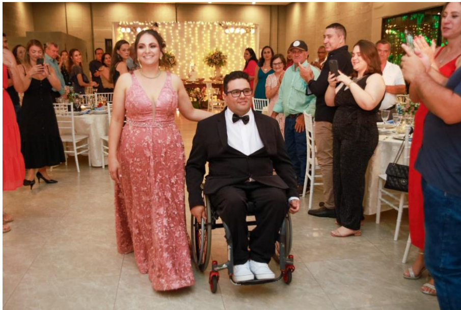
Figura 40. Entrada dos pais.