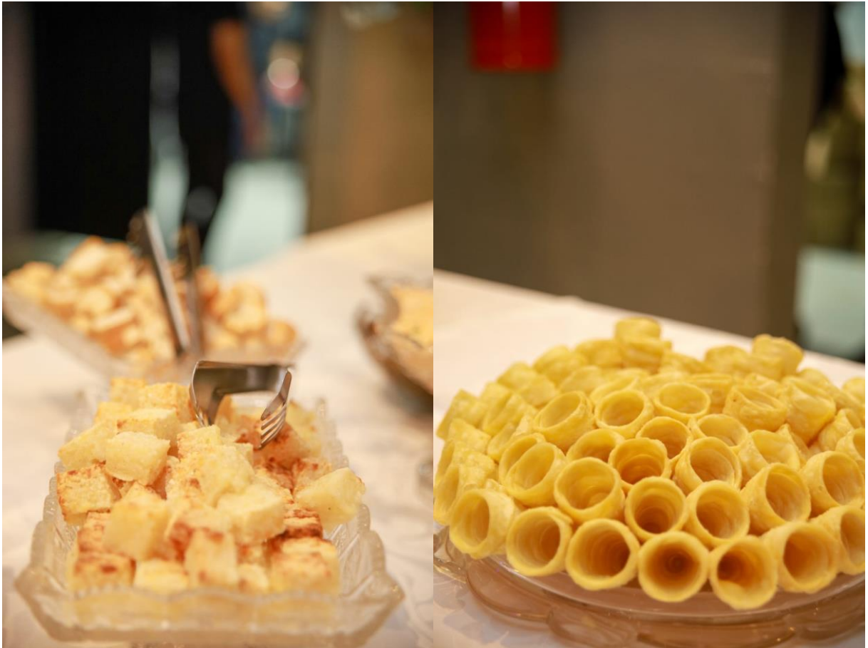
Figuras 32 e 33. Dadinho de tapioca e canudo frito.