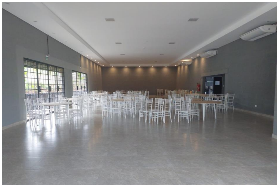
Figura 5. Vista do interior do Salão da Chácara Felicidade.