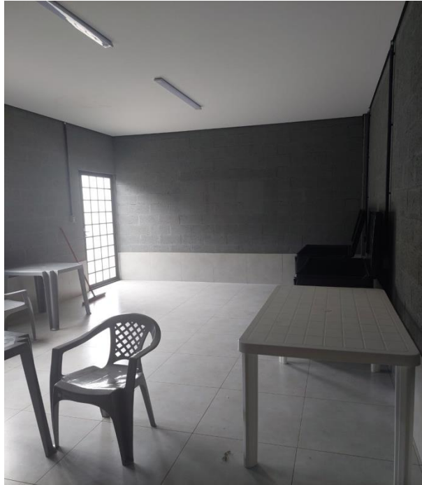
Figura 13. Área de apoio e armazenamento de bebidas.