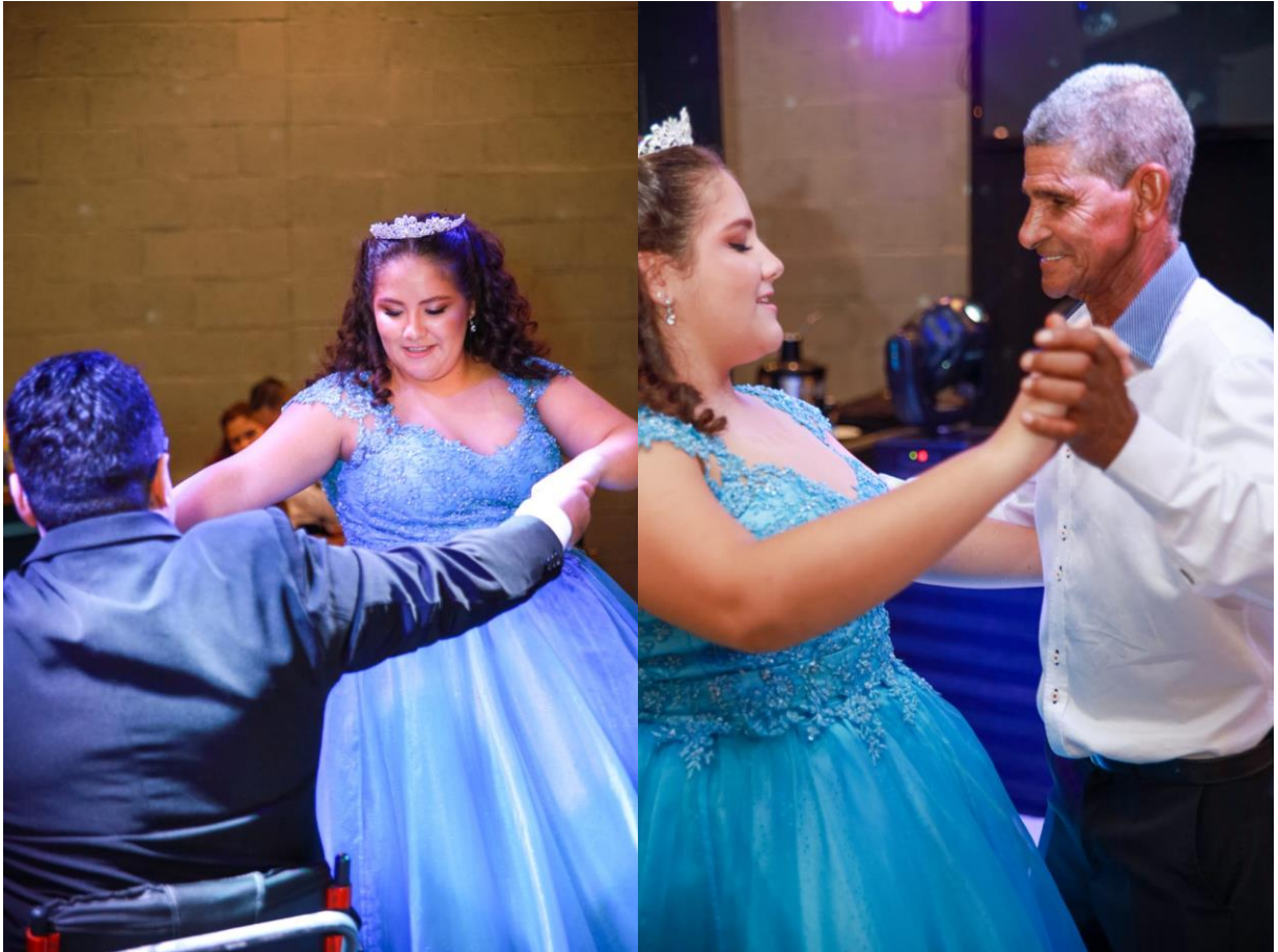
Figuras 44 e 45. Valsa com o pai e o avô materno.

proteção, por isso, geralmente a valsa é dançada com o pai ou com pessoas muito próximas.