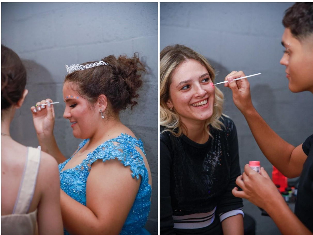
Figuras 56 e 57. Pintura facial com tinta neon.