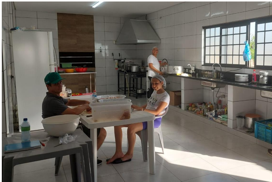
Figura 14. Equipe de cozinha no dia da festa.