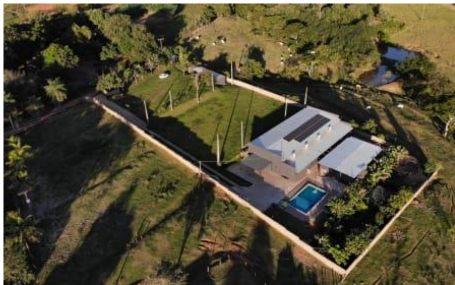
Figura 3. Vista aérea da Chácara Felicidade.