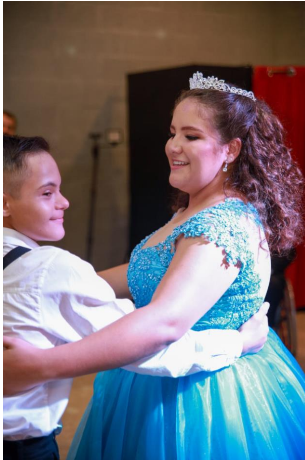
Figura 48. Valsa com o primo.