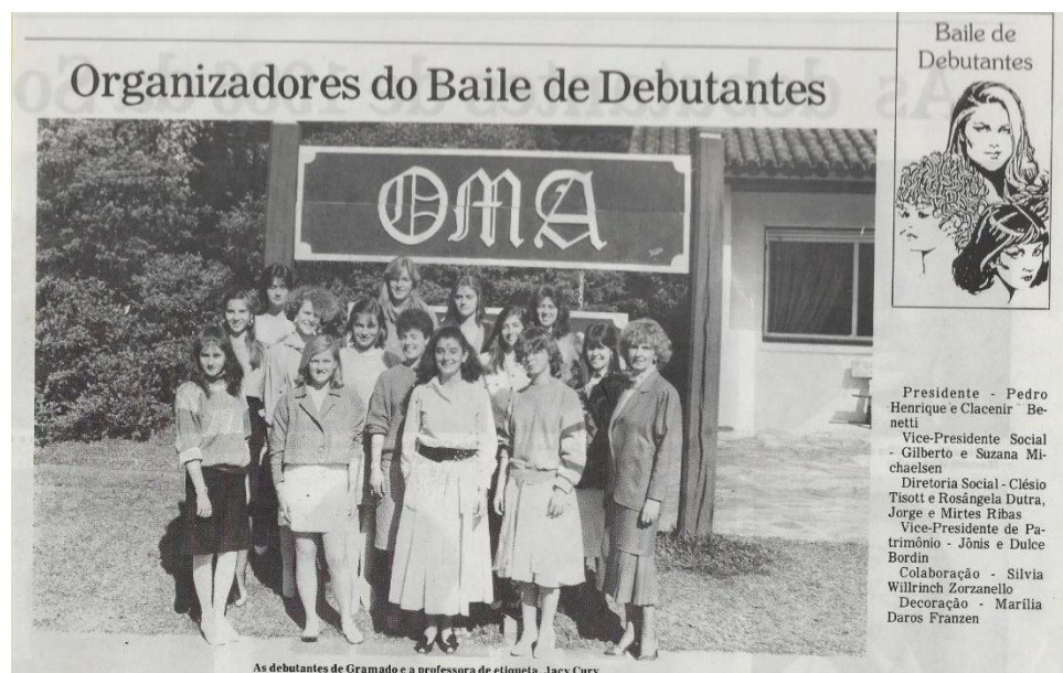
Figura 1. Recorte de jornal do ano de 1963 retratando a equipe organizadora do baile de debutantes da época.

De acordo com Machado de Assis (1957 1 ) “Aos 15 anos tudo é infinito”. A tradição de celebrar 15 anos vem dos nobres da Europa, apresentando sua filha à sociedade, marcando a transição da infância para vida adulta. Essa tradição ultrapassou continentes e chegou ao Brasil entre as décadas de 50 e 60, mesmo com passar do tempo e com tanta inovação, o estilo clássico e a valsa ainda são os mais usados entre meninas que sonham em comemorar em grande estilo.