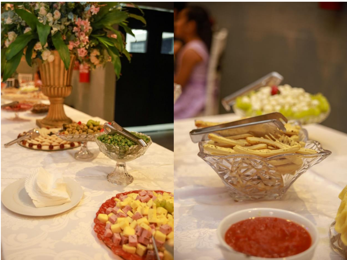
Figuras 28 e 29. Cardápio de entrada servido no aparador.

No cardápio de entrada, foi servido: mini pão sírio, palitos de alho, torrada, canudo frito, dadinho de tapioca, escabeche de berinjela, patê de frango, molho verde, geleia de pimenta, frios, azeitona, ovos de codorna, amendoim e salgadinhos diversos.