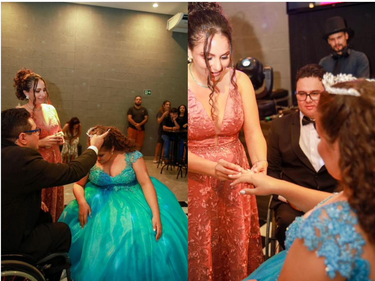
Figuras 42 e 43. Troca do laço pela coroa e entrega do anel.