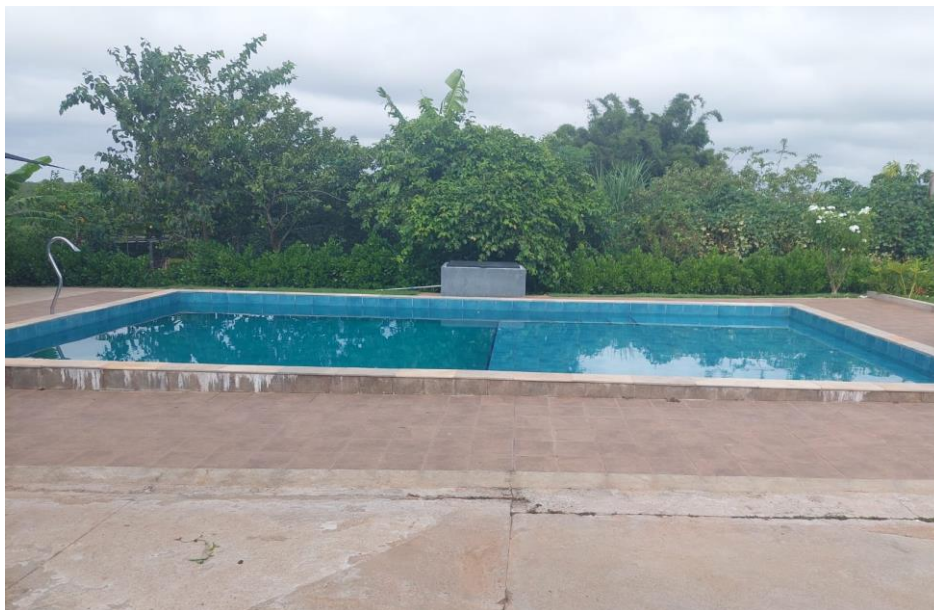
Figura 10. Piscina.