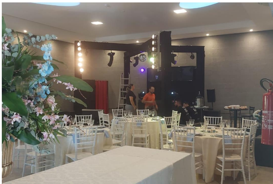
Figura 18. Pista de dança pronta e teste de som e luz.