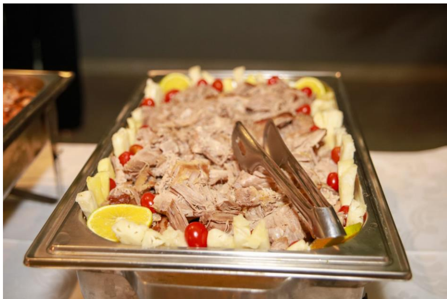
Figura 35. Sobre paleta suína.