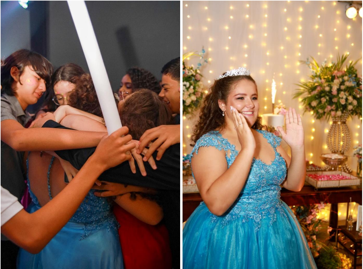
Figuras 51 e 52. Homenagem dos amigos e os parabéns.