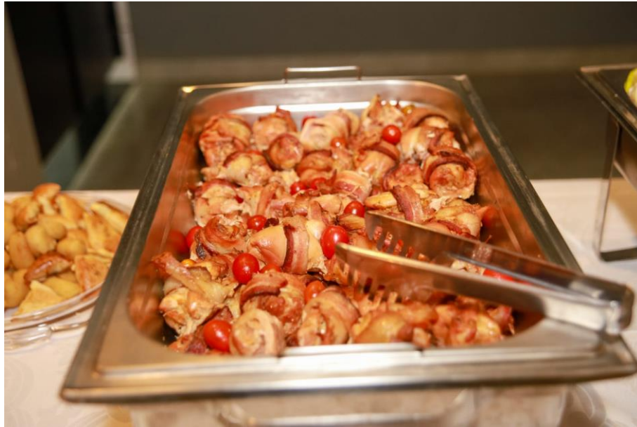
Figura 34. Medalhão de frango.