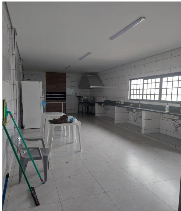
Figura 12. Cozinha do salão no dia da visita técnica.