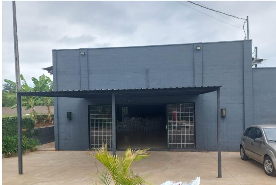
Figura 4. Entrada principal do salão.