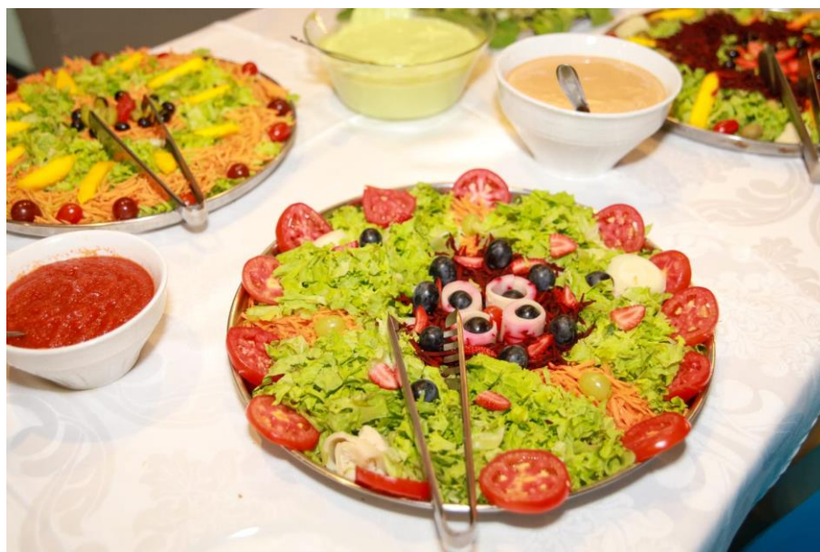
Figura 38. Saladas diversas.