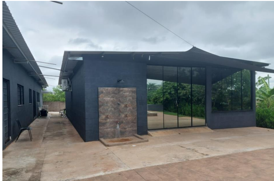
Figura 9. Área de lazer.