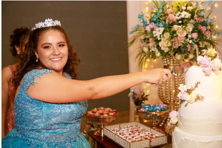
Figura 53. Corte simbólico do bolo.