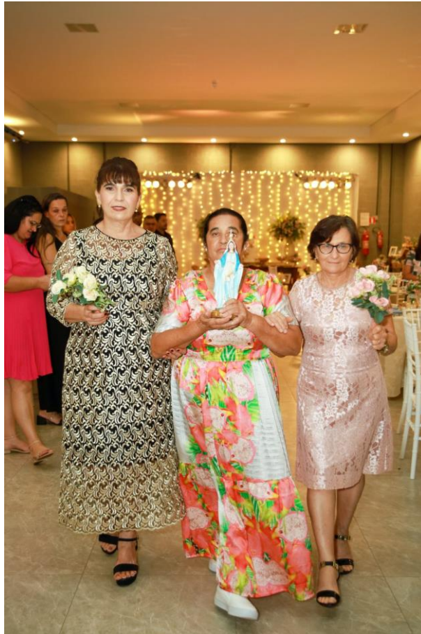
Figura 49. Entrada da imagem de Nossa Senhora.