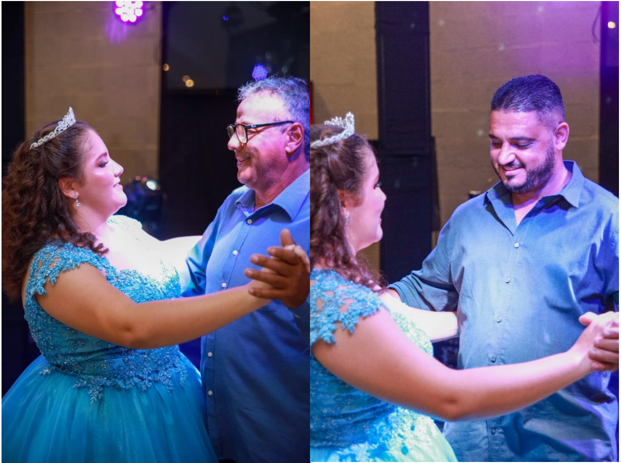
Figuras 46 e 47. Valsa com o avô paterno e o padrinho.