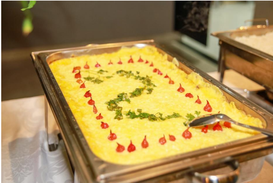
Figura 36. Escondidinho de carne seca.