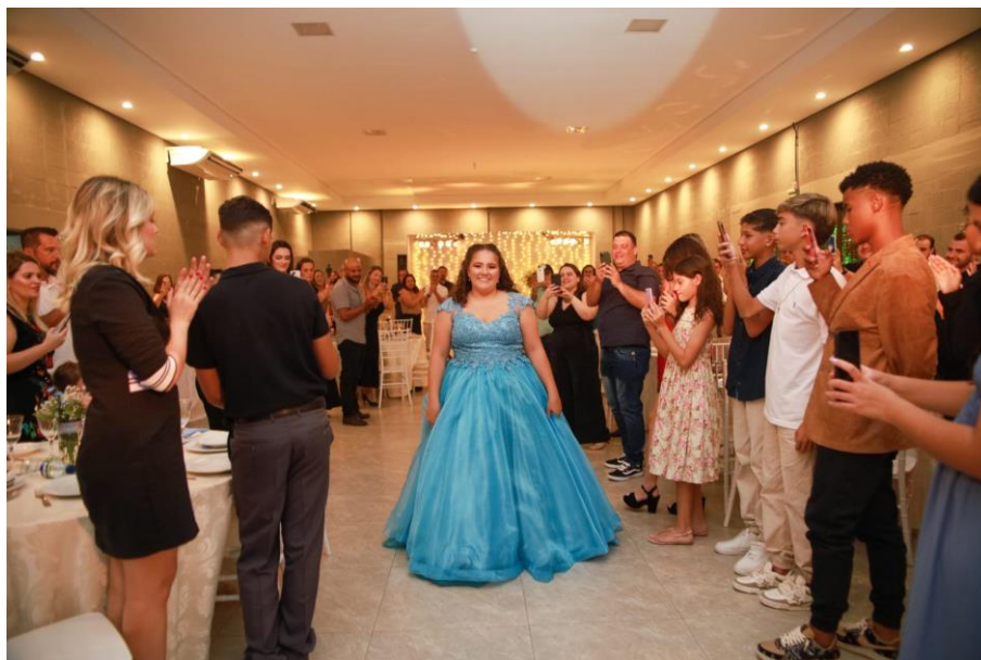
Figura 41. Entrada da debutante.