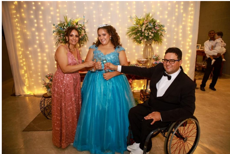
Figura 54. Brinde com os pais.