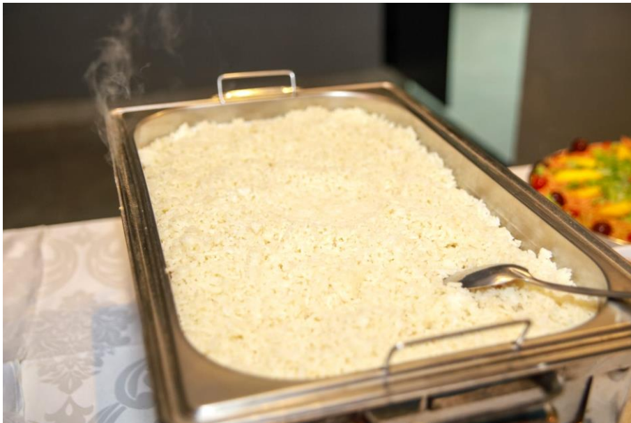
Figura 37. Arroz branco.