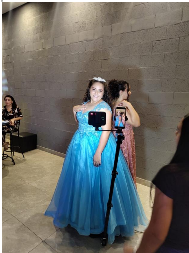
Figura 20. Abertura da plataforma 360°.