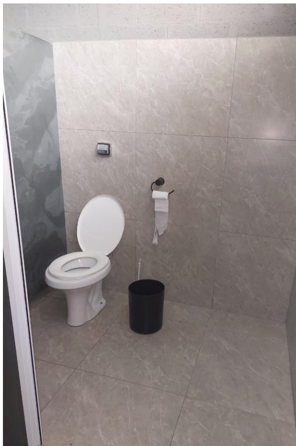
Figura 7. Banheiro para pessoas com deficiência.