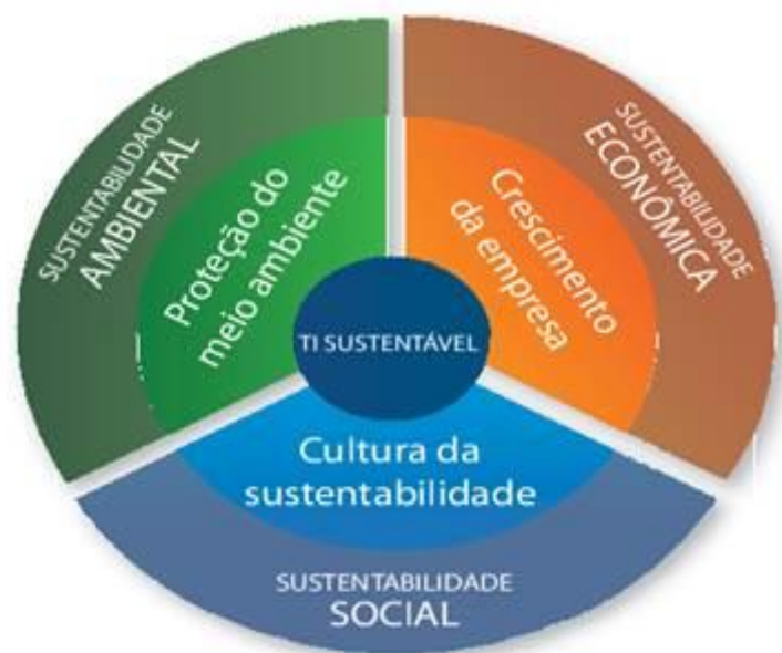
Figura 1: Tripé da Sustentabilidade.