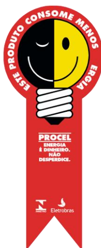
Figura 3 - Selo PROCEL de Eficiência Energética