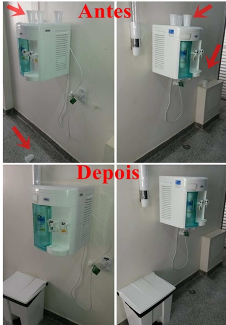
Figura 6. Antes: falta de lixeira e copos espalhados em vários locais inadequados. Depois: lixeira e ambiente livre de sujeira

Antes da implantação do Senso, não havia lixeira próxima ao bebedouro e o descarte dos copos era feito de maneira errada, deixando o ambiente com aspecto desagradável. Após a colocação da lixeira, observou-se um ambiente organizado e livre de sujeiras.