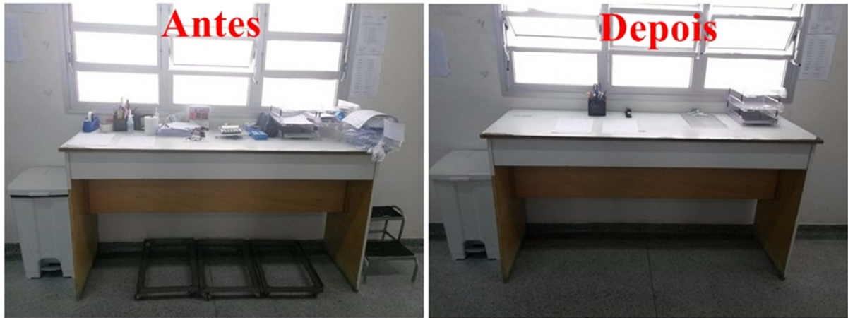
Figura 2. Balcão de processamento de documentos

Antes da implantação do Senso de utilização, havia muitos materiais desnecessários que ocupavam muito espaço; depois, observa-se o posto de trabalho organizado e com maior espaço livre para a execução das atividades e somente com os materiais necessários dispostos em seus devidos lugares, facilitando, assim, as operações.