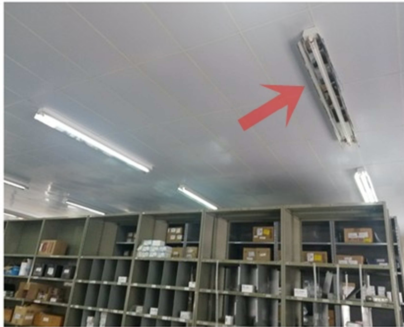
Figura 10. Lâmpada queimada

Outro aspecto observado que deve ser analisado é a disposição das luminárias entre as prateleiras. Conforme a Figura 11, o sentido das luminárias não acompanha o sentido das prateleiras, ou seja, os corredores não são iluminados suficientemente.