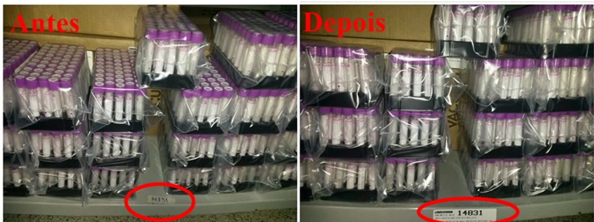
Figura 4. Antes: etiqueta de identificação improvisada. Depois: etiqueta padronizada contendo o código e a descrição do material

Após a implantação do Senso de ordenação, as etiquetas foram confeccionadas com um modelo padronizado que contém o código do material e a sua descrição, evitando-se, assim, erros de estocagem e de identificação dos materiais na hora de dispensá-los quando solicitados.