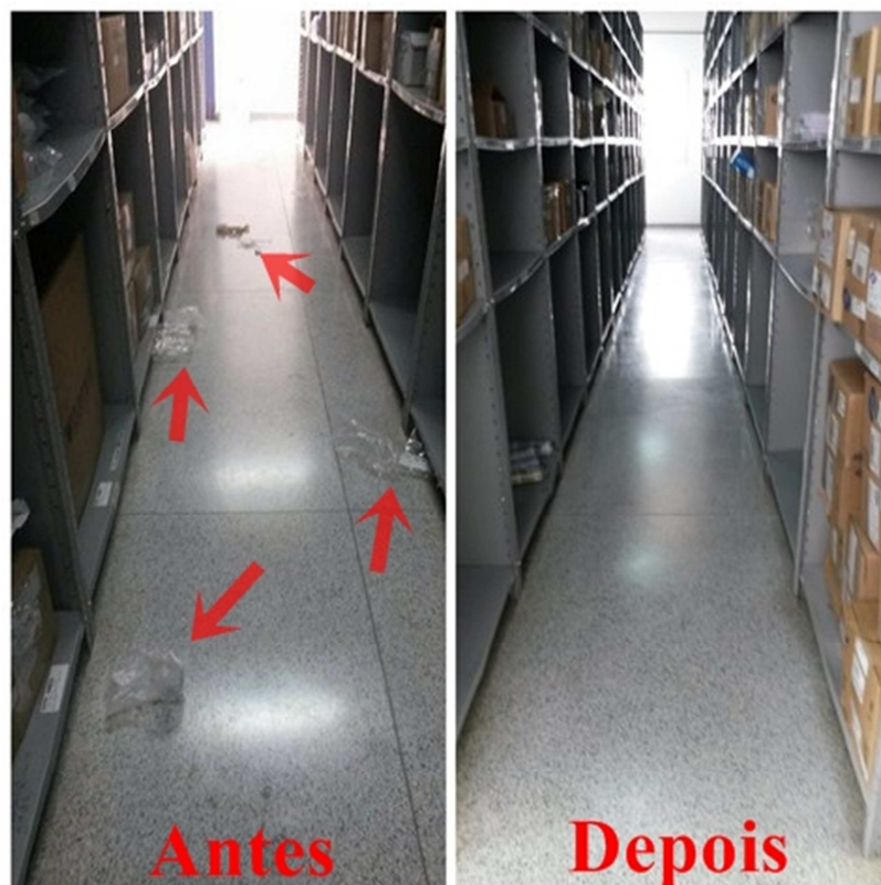
Figura 5. Antes: corredor entre as prateleiras com sujeira. Depois: corredor com o chão limpo

Depois da implantação do Senso de limpeza, as pessoas colaboram e descartam devidamente os materiais desnecessários em lixeiras espalhadas em diversos locais no setor.