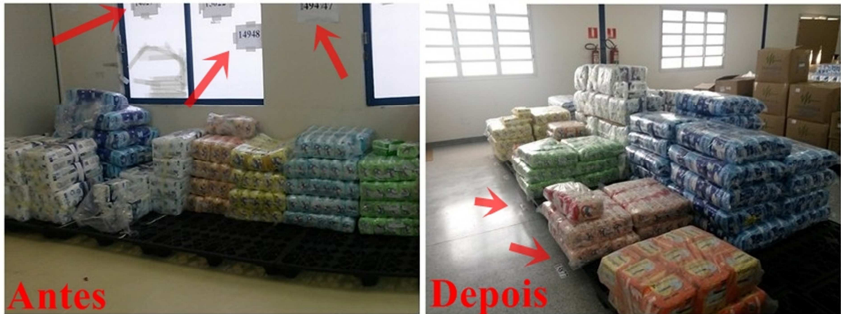
Figura 3. Antes: falsa sensação de ordenação. Depois: etiquetas dispostas corretamente à frente de cada tipo de materiais devidamente armazenados nos paletes

Antes da implantação do Senso de ordenação, as etiquetas eram improvisadas, conforme Figura 4.