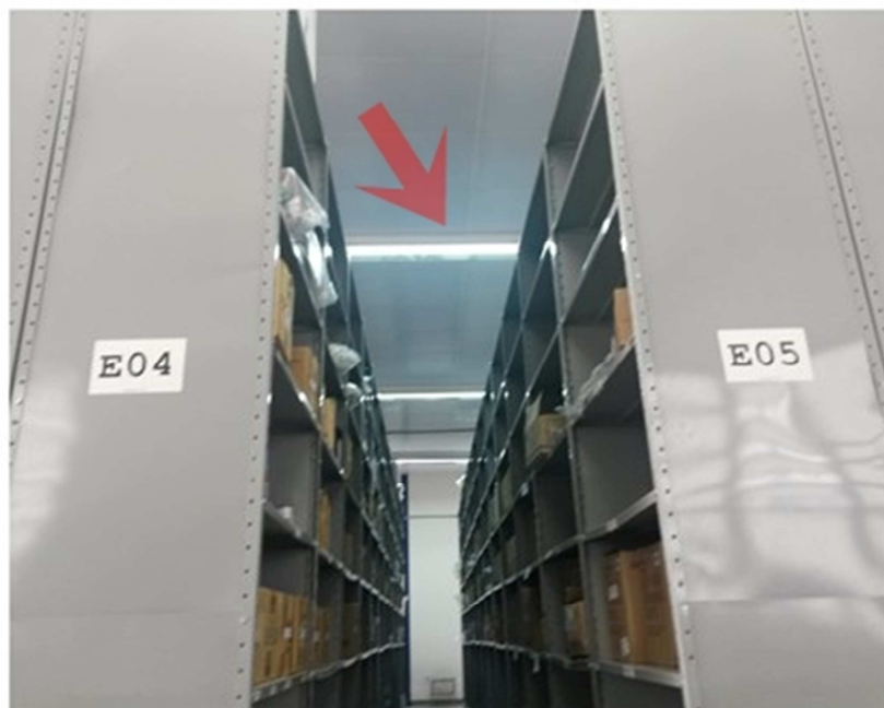
Figura 11. Disposição errônea de iluminação entre as prateleiras

Outro aspecto observado que deve ser analisado é a disposição das luminárias entre as prateleiras. Conforme a Figura 11, o sentido das luminárias não acompanha o sentido das prateleiras, ou seja, os corredores não são iluminados suficientemente.