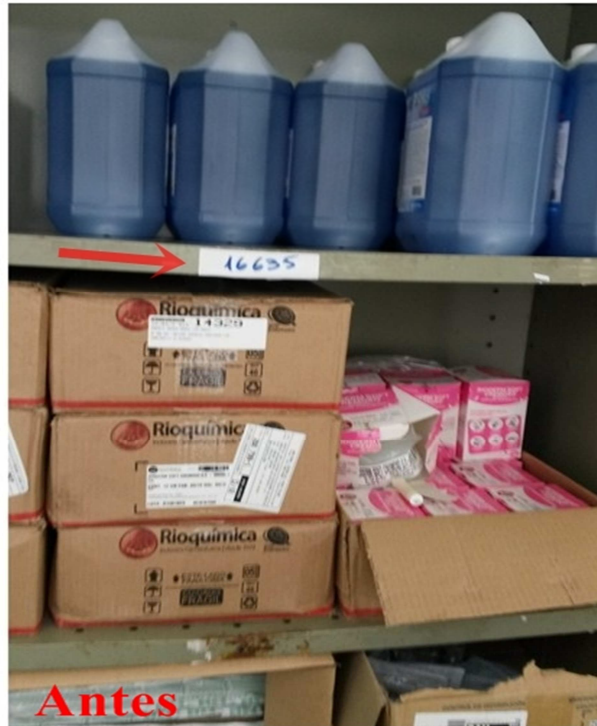
Figura 8. Materiais de difícil manipulação no alto da prateleira e etiqueta inadequada de identificação

Com a implantação do Senso de padronização, os materiais com maior dificuldade de manuseio foram armazenados em paletes com etiquetas de identificação adequadas, facilitando assim as operações, garantindo a integridade física das pessoas e evitando-se os riscos de acidentes, conforme Figura 9.