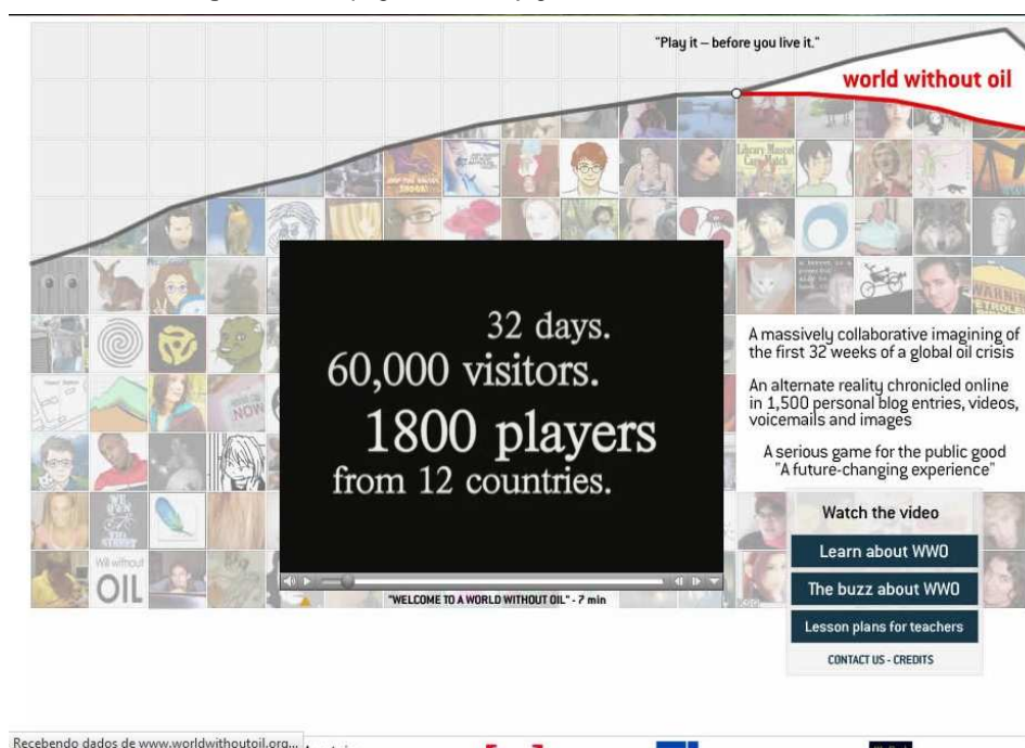
Figura 3: Homepage do site do jogo “World Without Oil”

Segundo a análise de Rezende (2011) sobre a estrutura do plano de ensino proposto pelos criadores de World Without Oil , o primeiro ponto para a incorporação do ARG na metodologia de ensino é “fazer a imersão dos alunos frente ao cenário de jogo”, ou seja, a formulação de um contexto inicial ou um cenário. No caso do jogo em questão, o contexto inicial seria o primeiro dia da crise mundial do petróleo, e o súbito aumento nos preços do combustível. Ao longo do desenvolvimento do jogo, a história deve evoluir com as descobertas dos alunos.