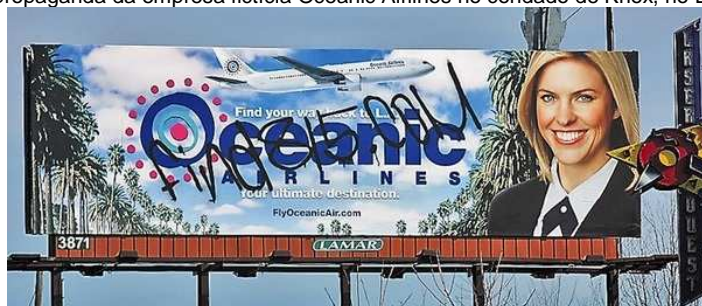
Figura 2 : Outdoor com propaganda da empresa fictícia Oceanic Airlines no condado de Knox, no Estado do Tennessee, USA

O jogo foi lançado no período entre a terceira e a quarta temporadas da série, e possibilitou aos fãs sentirem-se parte da história em um nível ainda maior do que somente assistindo ao programa.