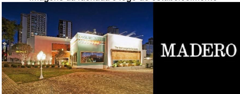
Fonte: Site Madero