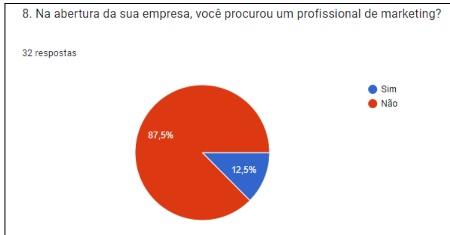
Gráfico 3: Gráfico de procura por um profissional de marketing.

Observou-se que 87,5% não procuraram um profissional de marketing ao abrir sua empresa, enquanto a pequena parcela que procurou apontou que utilizou ferramentas como panfletagem, tráfego pago, outdoor, redes sociais em geral e estratégias desenvolvidas com a equipe interna.