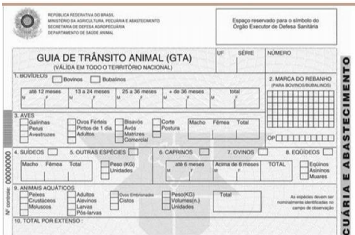
Figura 04 - GTA – Guia de Transporte Animal