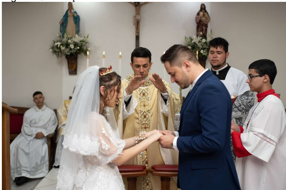
Figura 13 - Bênção dos noivos

Uma das bênçãos realizadas durante o Rito do Matrimônio é realizada visando os noivos e sua união, dada por Deus por meio do padre celebrante. Na imagem é possível observar os noivos com as mãos dadas e o padre com as mãos estendidas em direção à essa união física. Ao lado do padre há um acólito, com vestes preta e branca, e coroinha, com vestes vermelha e branca, ambos auxiliando o sacerdote nesse momento.