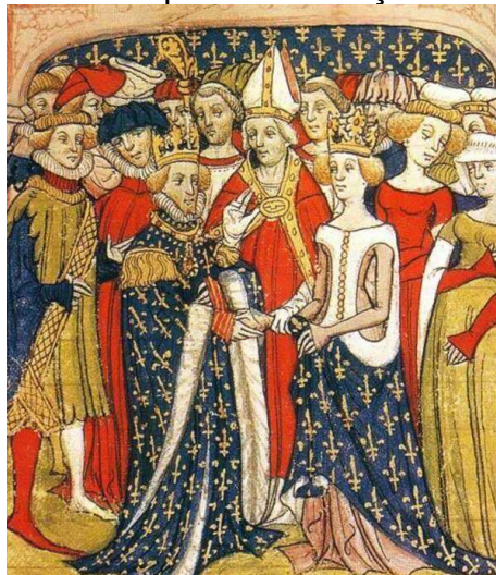
Figura 1 - Casamento de Filipe III da França e Maria de Brabante

Como na Europa, durante a Idade Média, onde o casamento era visto como um negócio entre duas linhagens familiares e com fortes ligações políticas, e mesmo com a necessidade do consentimento dos noivos, isso era considerado mera formalidade (COSER, 2008). A figura abaixo mostra o casamento de Filipe III de França com Maria de Brabante, filha de Henrique III de Brabante, datada do final do século XIV, realizado, muito provavelmente, em ritos e condições católicas.