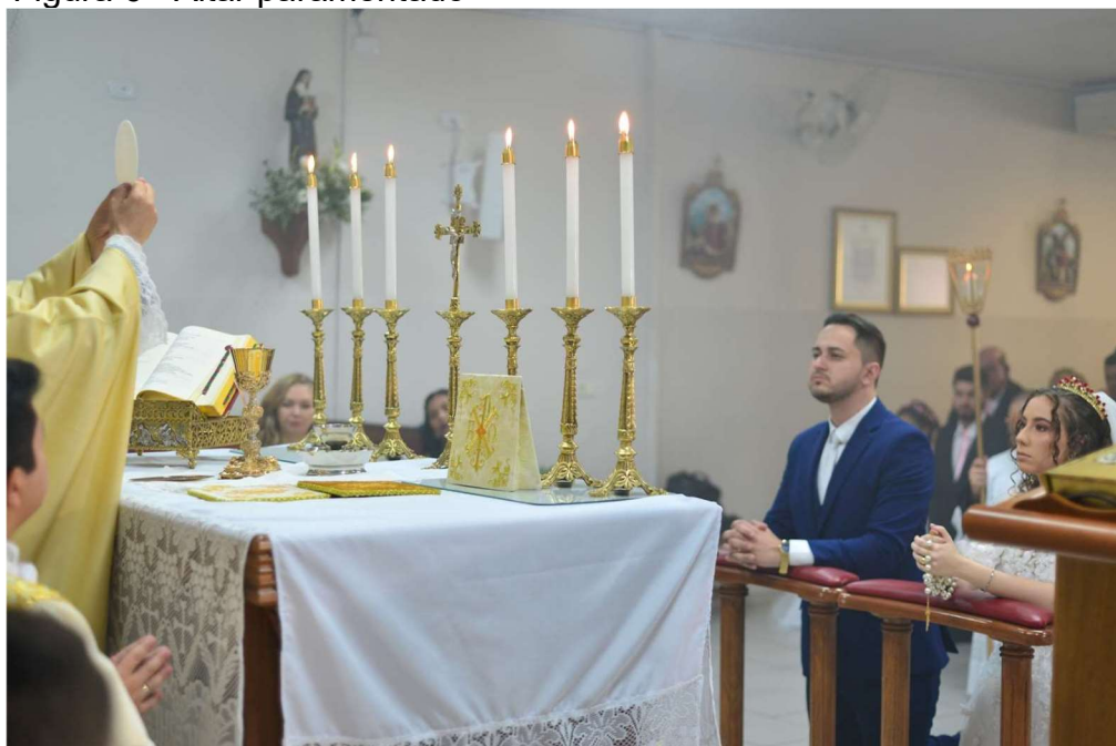
Figura 6 - Altar paramentado