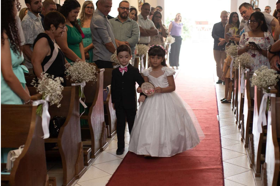
Figura 12 - Cortejo das alianças