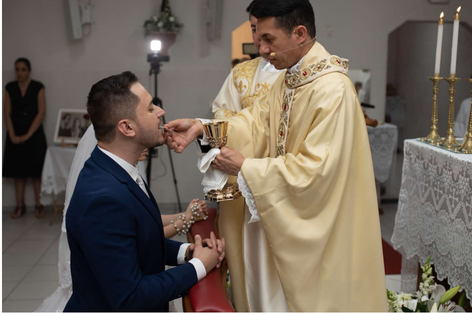
Figura 16 - Comunhão dos noivos