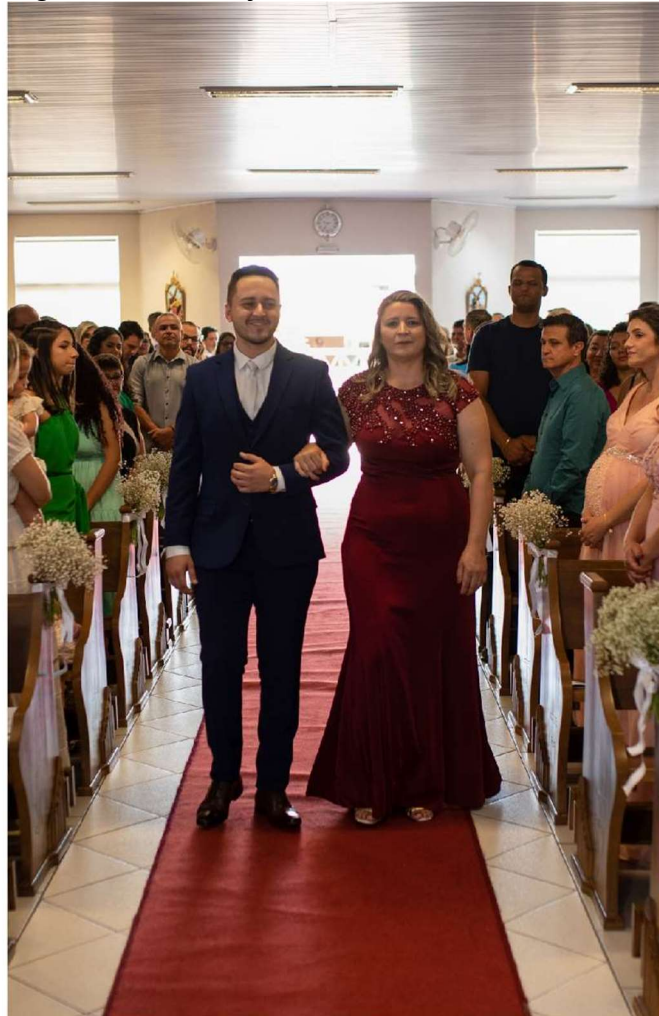
Figura 10 - Cortejo do noivo com sua mãe