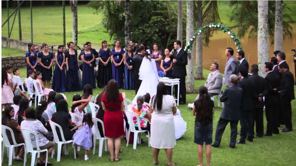
Figura 4 - Casamento na Congregação Cristã no Brasil

tem-se uma imagem de um casamento realizado nesta religião em 2015.