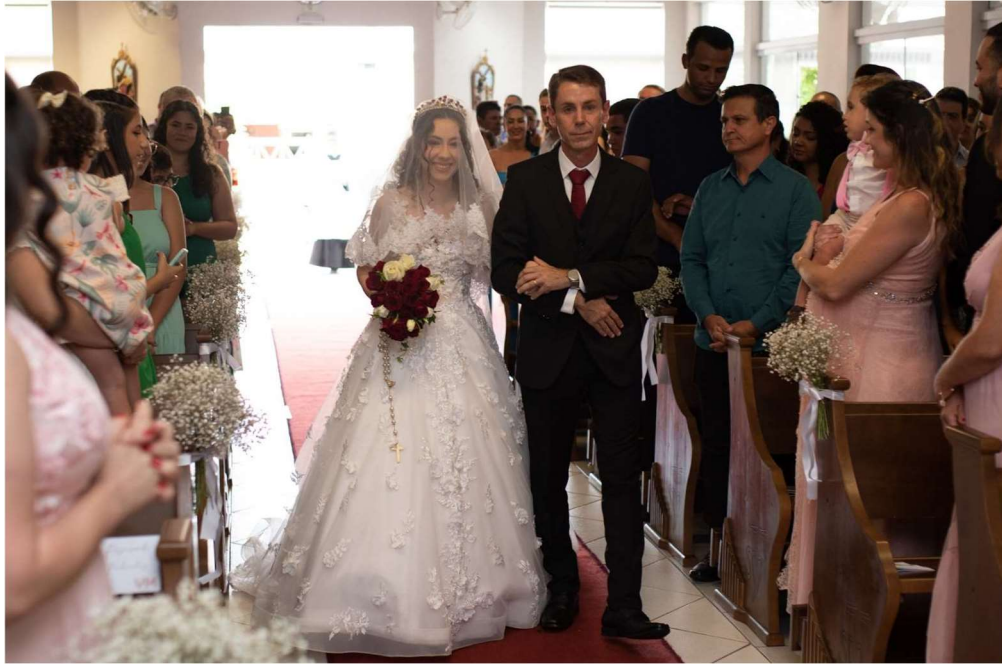
Figura 11 - Cortejo da noiva e seu pai