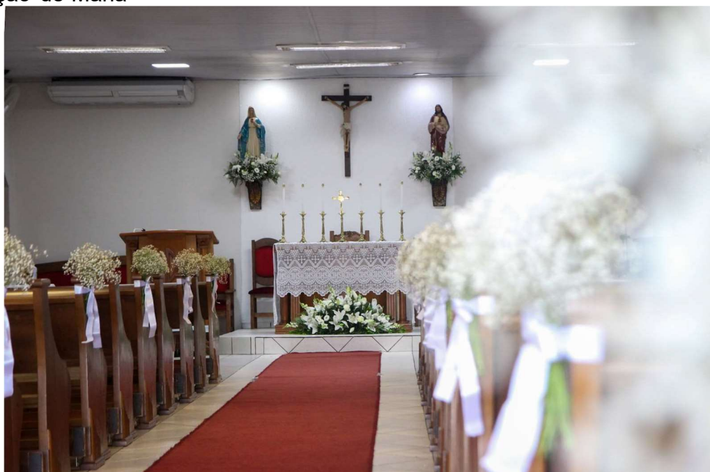
Figura 5 - Interior da Capela Sagrado Coração de Jesus e Imaculado Coração de Maria

ressurreição de Jesus Cristo. No arranjo sob o altar tem destaque os lírios, flores que representam a pureza da Sagrada Família.