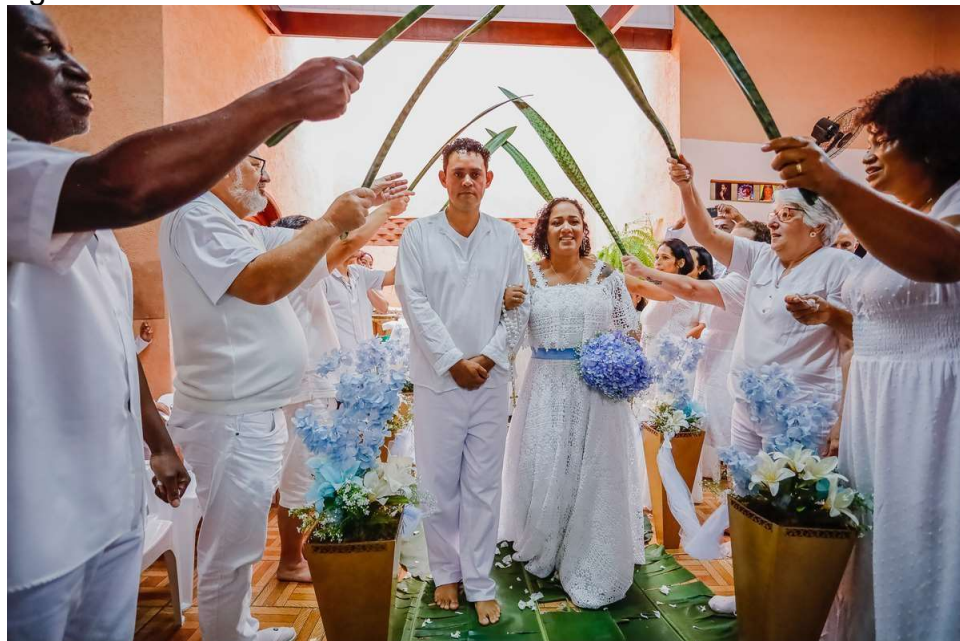
Figura 3 - Casamento na Umbanda

No Brasil encontra-se diversidade de ritos religiosos e sociais envolvendo o casamento, assim como leis cada vez mais especializadas nas questões de direitos e deveres da família e nas questões burocráticas de contratos civis de união estável e casamentos. Por mais que inicialmente o casamento no Brasil fosse influenciado pela religião católica, hoje em dia há diversidade de celebrações, por exemplo na Umbanda, caracterizada pelo sincretismo religioso, que podem acontecer em um terreiro e a bênção aos noivos é realizada por elementos da natureza (CANUTO, 2021). A figura 3 a seguir é uma fotografia de um casamento nesta religião.