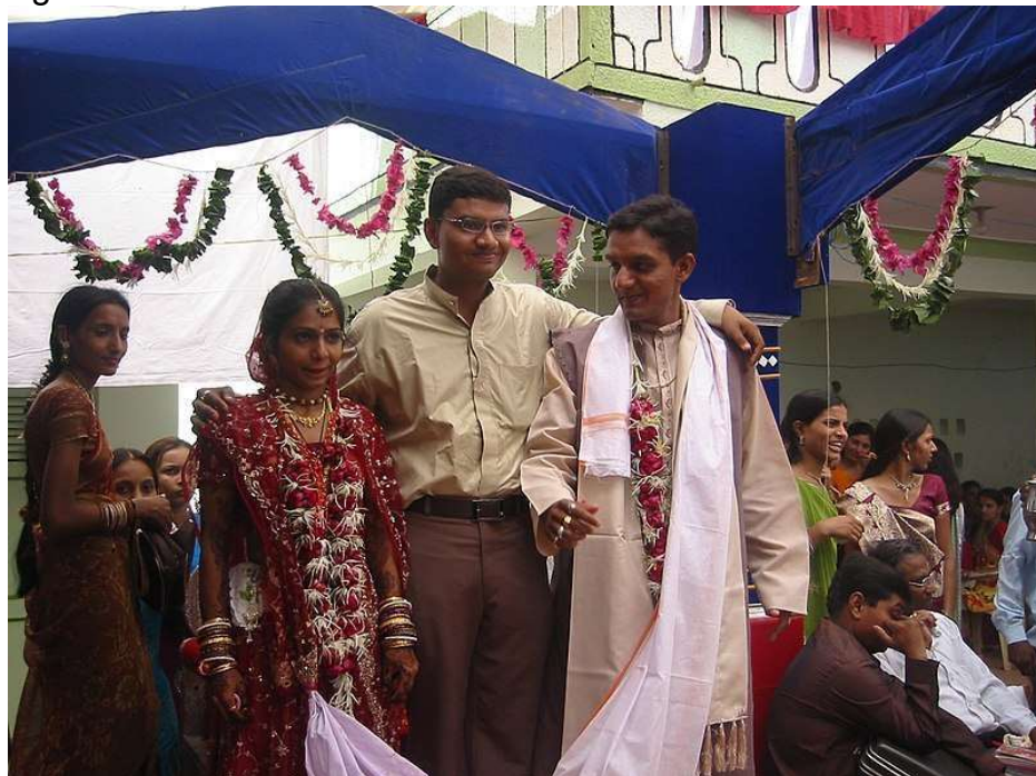
Figura 2 - Casamento indiano

Na figura 2 tem-se uma fotografia de um casamento indiano, onde os noivos são os que possuem colares de flores vermelhas, tradicionais no rito. Entre eles há um homem e em volta deles há pessoas sentadas e em pé, que provavelmente são os convidados para a celebração.