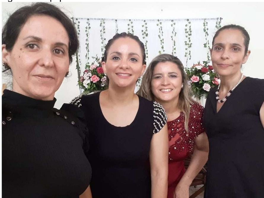
Figura 7- Equipe de trabalho cerimonial