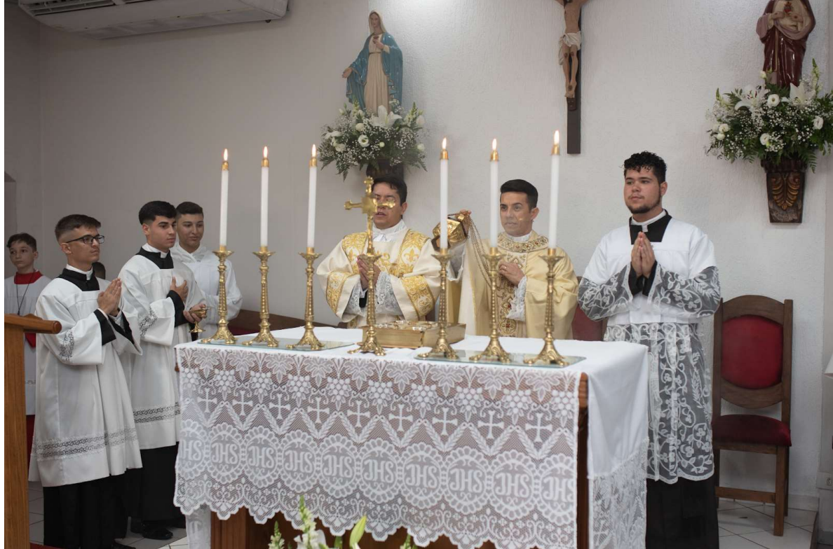
Figura 15 - Incensação do altar

auxiliado pelo diácono (à esquerda) e acólitos.