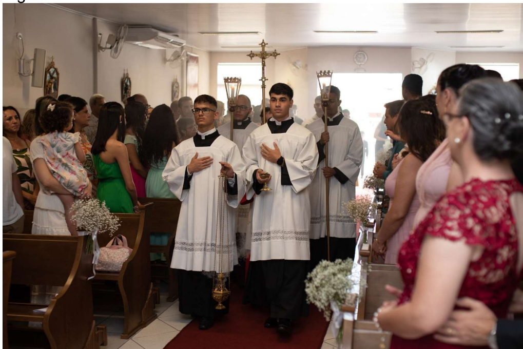
Figura 8 - Procissão de entrada