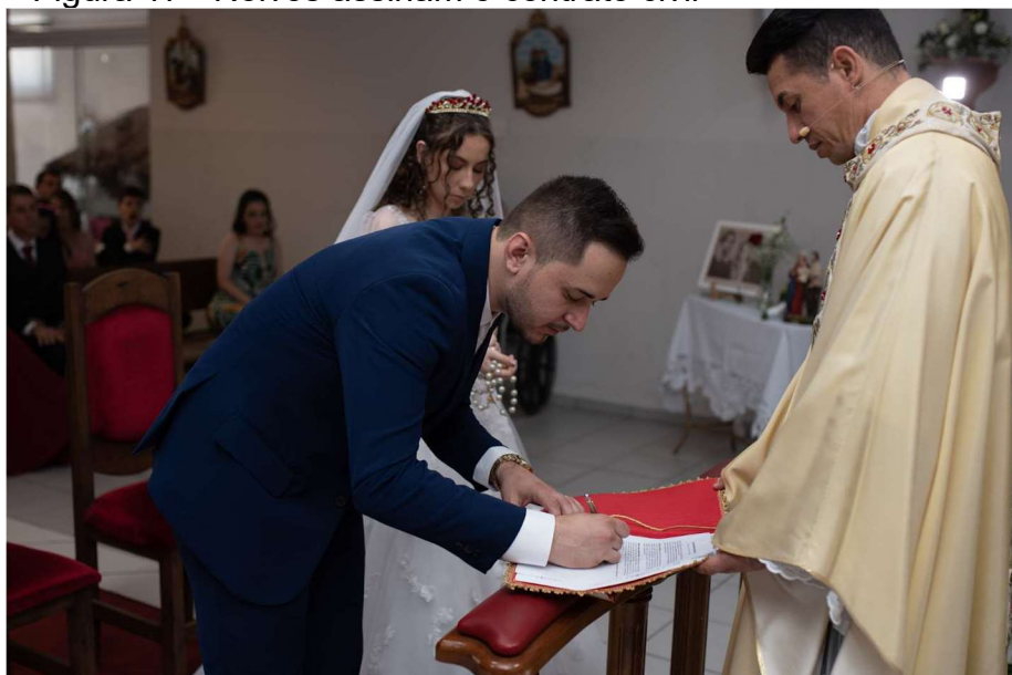
Figura 17 - Noivos assinam o contrato civil

Após o rito do Matrimônio, como pede a Santa Igreja, o casal assina também o documento do casamento civil. Os noivos, em questão, optaram pela celebração religiosa com efeito civil e, portanto, assinaram o contrato de casamento neste mesmodia e local. Na figura 17, abaixo, mostra o momento em que o noivo assina o contratode casamento, sendo o padre o reconhecido Juiz Eclesiástico de Paz.