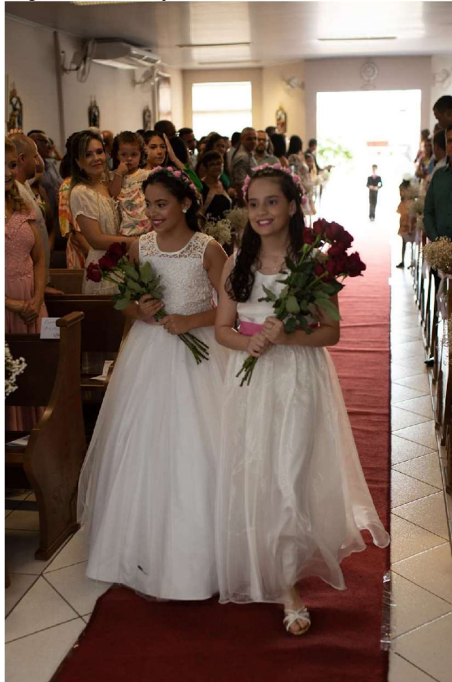
Figura 9 - Cortejo das daminhas