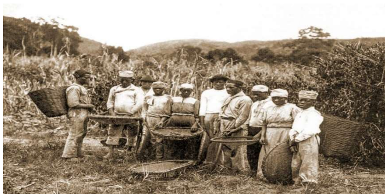
Colhedores de café em foto de Marc Ferrez

O candomblé começou a ser perseguido no começo e no período de pós-escravidão de 1550 a 1888, onde os praticantes da religião eram perseguido presos ou até mortos por causa da sociedade e das autoridades, já que desconfiavam que eram de rituais pagãos ou bruxaria, e por isso era proibido e sua prática no Brasil. Mas somente em 1946, foi decretada no Brasil a liberdade de culto religioso.