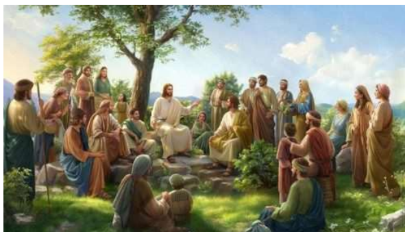
O pequeno rebanho – Vatican News

Porem ao longo dos anos, o cristianismo também enfrentou desafios e divisões internas. Guerras religiosas, divergências teológicas e interpretações variadas da fé levaram a diferentes ramificações e cismas dentro da religião. E apesar das diferenças, o cristianismo continua a ser uma fonte de esperança, conforto espiritual e orientação moral para muitas pessoas. Sua mensagem de amor ao próximo, perdão e redenção é ensinada até hoje, influenciando a vida de muitas pessoas ao redor do mundo.