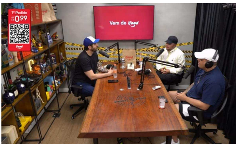
Figura 2: Anúncio de publicidade no Podcast Podpah