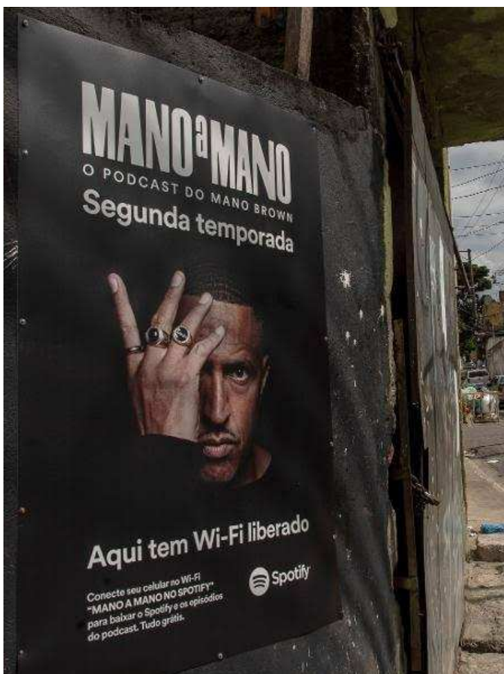
Figura 3: Banner de anúncio da disponibilização de internet gratuita e da segunda temporada do Mano a Mano