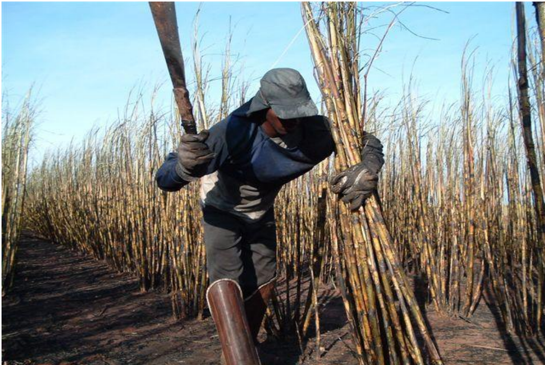
Figura 1 - Cortador de cana

Conforme Alves (2006) no início da década de 1950 a produtividade do trabalhador no corte de cana era de 3 toneladas por dia de trabalho e na década de 1980 saltou para 6 toneladas. Mas o aumento significativo ocorreu no final da década de 1990 e início dos anos 2000 quando a produtividade diária atingiu 12 toneladas de cana, um dos fatores que influenciou o incremento da produtividade do trabalhador decorre da forma de aferimento do ganho do cortador de cana que há muitos anos implantou-se no setor através do pagamento por produção. Por outro lado, a maior quantidade de cana plantada por hectare também contribuiu para o este aumento.