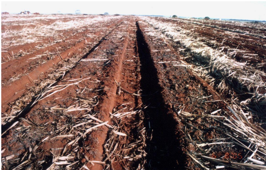
Figura 3 - Pisoteio por tráfego de máquinas agrícolas