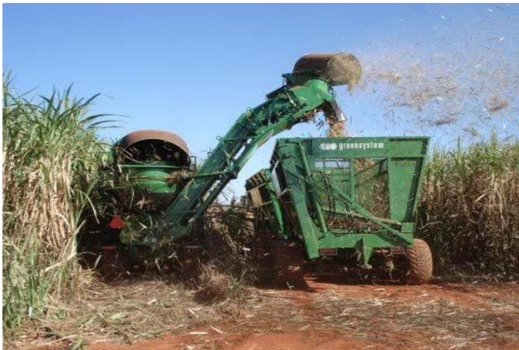
Figura 2 - Colheitadeira de cana de açúcar

De acordo com Ripoli (1996), existem 4 tipos de máquinas que podem realizar a operação de colheita de cana de açúcar, são elas: cortadoras, que apenas realizam o corte basal dos colmos; cortadoras enleiradoras, promovem o corte dos ponteiros, o corte basal e deixam os colmos enleirados no terreno; cortadoras amontoadoras, semelhantes as cortadoras enleiradoras porém formam montes de cana espaçados e colheitadeiras que são as máquinas mais utilizadas e mais eficientes na colheita mecanizada de cana de açúcar, sendo que realizam o corte dos ponteiros, corte basal do colmo, fracionando-os em toletes, limpeza de impurezas vegetais e minerais e promovem o carregamento diretamente nas unidades de transporte denominadas transbordos, representado pela Figura 3.