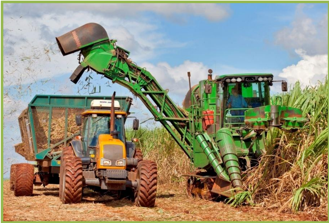
Figura 5 – Corte mecanizado sem queima prévia

De acordo com Vian (2003), a nova legislação ambiental que proíbe a queima da cana levou algumas usinas a adotarem a mecanização do corte da matéria-prima (Figura 6). Não se podem menosprezar as exigências de capital e de investimentos para o desenvolvimento de novas tecnologias e capital para o desenvolvimento de novas variedades produtivas adaptadas as condições dos locais de produção tanto para o corte manual como para o corte mecanizado. Isso atende também as demandas da legislação ambiental.