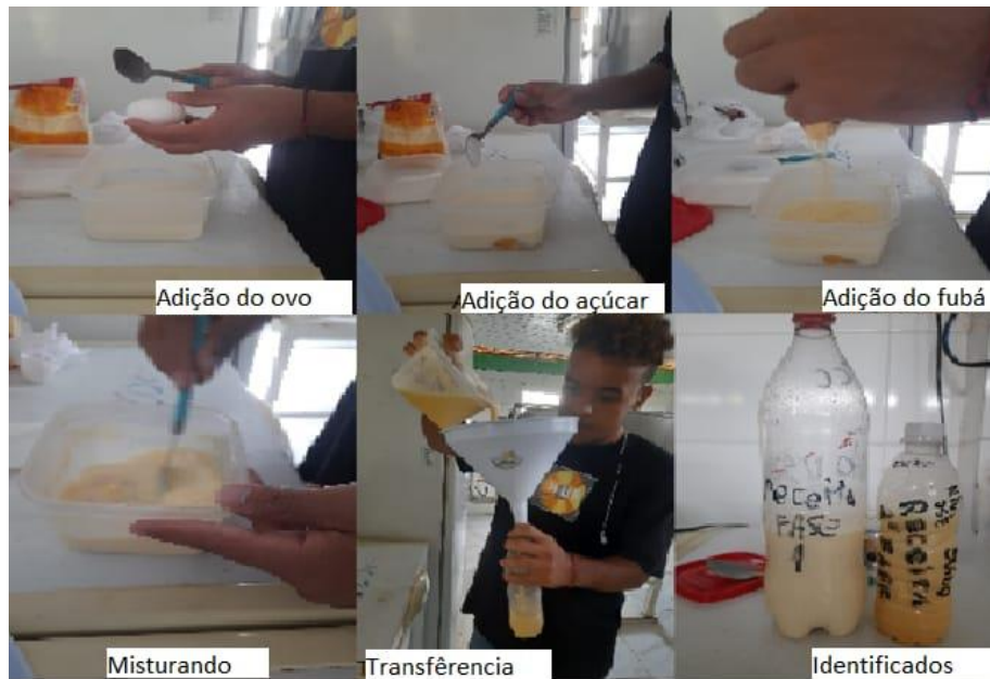
Figura 11 – Preparo da receita a partir do 15º de vida (2ª fase), sua transferência para um recipiente e identificação.