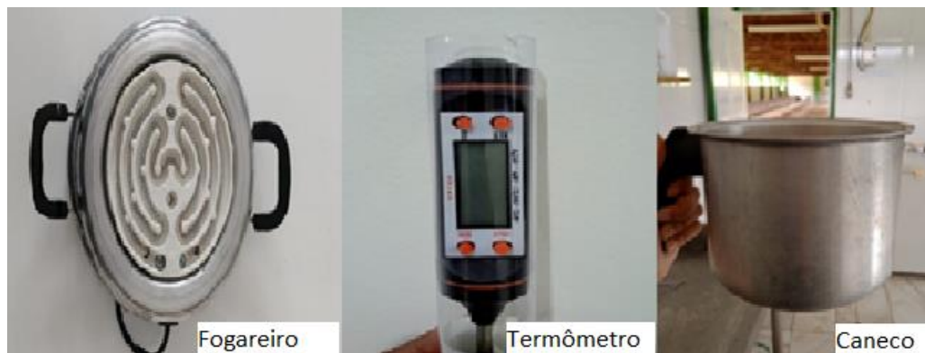
Figura 7 – Utensílios necessários para o descongelamento do colostro e leite.

O descongelamento dos recursos foi realizado por meio do banho-maria, utilizando-se um fogareiro, pois micro-ondas não pode ser utilizado, com o auxílio de um termômetro de cozinha foi aferido a temperatura, garantindo assim que não ultrapassasse o limite de 53°C (REICH et al., 2016), além de um caneco de cozinha que ajudou no armazenamento enquanto o colostro e o leite descongelavam (FIGURAS 7 e 8).