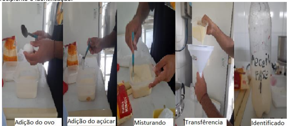
Figura 10 – Formulação da receita a partir da 1ª semana de vida (1ª fase), sua transferência para um recipiente e identificação.