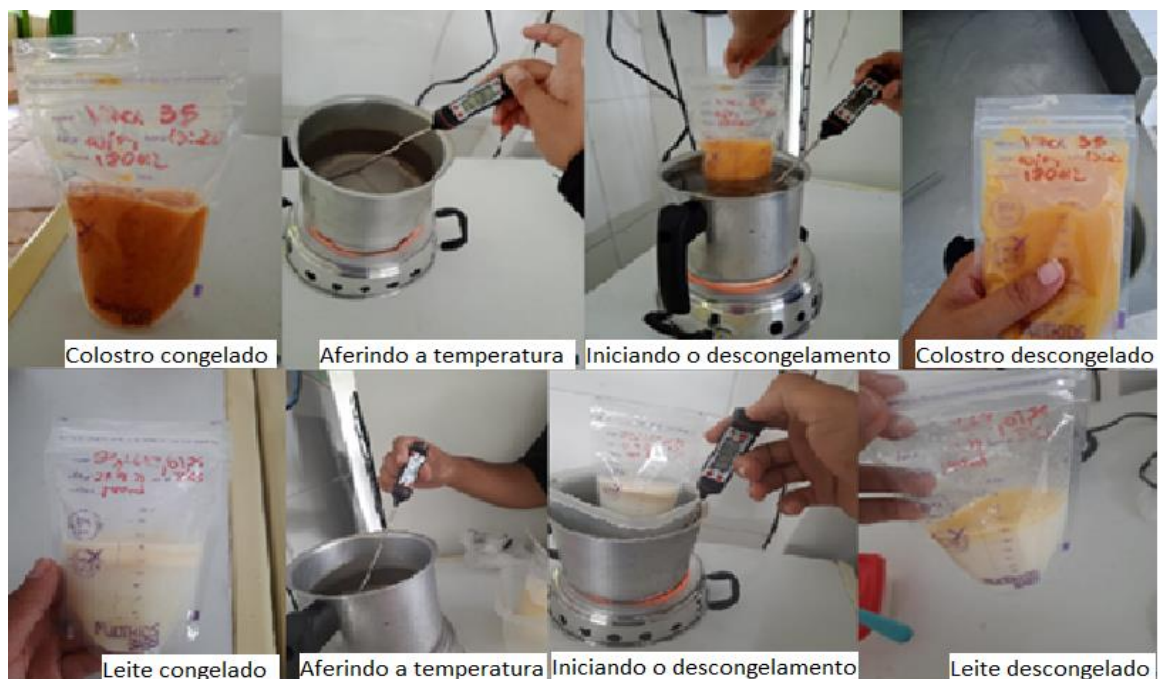
Figura 8 – Processo de descongelamento do colostro e leite.