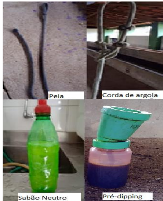
Figura 2- Corda de peia e argola, sabão neutro e pré-dipping