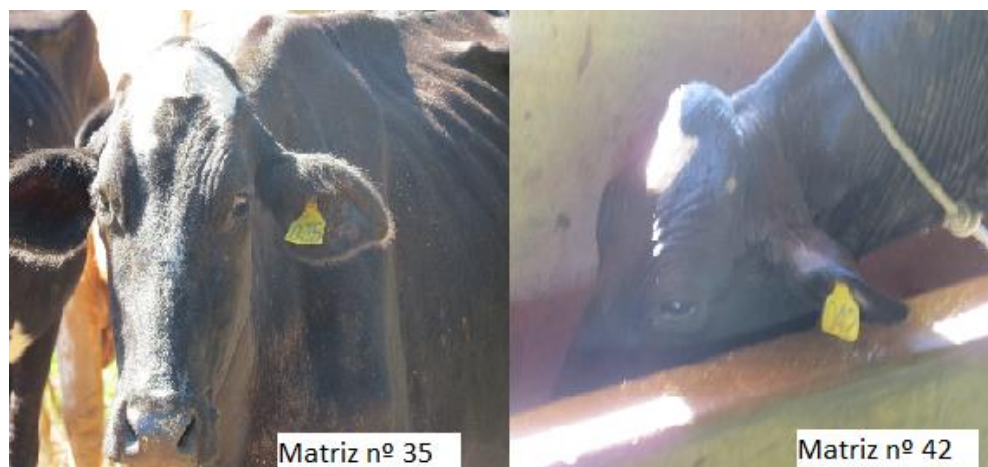
Figura 1 - Matrizes doadoras.

Para o desenvolvimento deste trabalho, foram selecionadas duas matrizes doadoras (colostro e leite) utilizando-se para isso alguns critérios já determinados, segundo o autor SOARES C.M. (FIGURA 1).