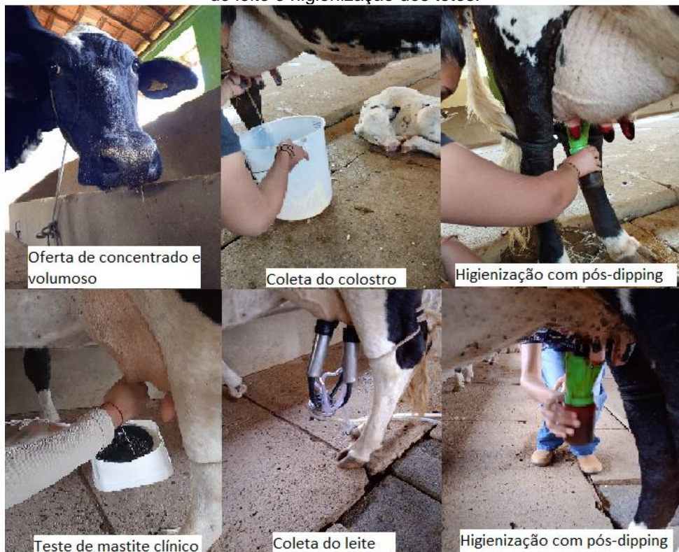
Figura 4 - Oferta de volumoso e concentrado, coleta do colostro, teste de mastite clínica para coleta do leite e higienização dos tetos.

A coleta do colostro e do leite aconteceram no dia 10 de setembro de 2022, sendo que o colostro foi coletado da vaca número 35, já o leite do animal 42. Para a iniciar as coletas, foram ofertadas as matrizes concentrado e volumoso proporcionando um menor estresse animal, pois neste caso, o colostro foi coletado manualmente e o leite de forma mecanizada (sistema de ordenha mecânica balde a o pé). Para o recolhimento do colostro, foi necessário somente a contenção e higienização, já para a coleta do leite, antecedendo a extração foi realizado também o teste para a mastite clínica. Após as coletas, os tetos foram higienizados com uma solução de iodo chamado pós dipping (FIGURA 4).