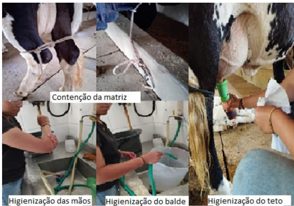
Figura 3 - Contenção e higienização do ordenhador, utensílios e animal.