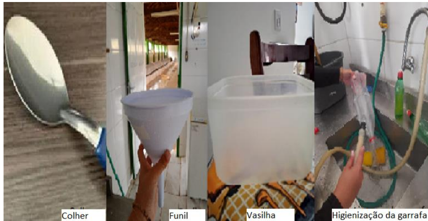
Figura 9 – Utensílios para o preparo do leite a ser oferecidos aos leitões.

De acordo com Gomyde (2004), abaixo ilustrações do preparo do leite a ser ofertado aos suínos a partir da primeira semana de vida até o seu desmame em seguida a sua transferência para um recipiente e identificação (FIGURA 9, 10 e 11).