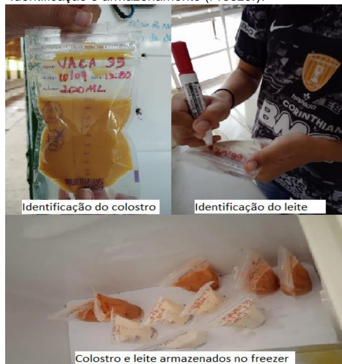
Figura 6 - Identificação e armazenamento (Freezer).

Em seguida os sacos de estocagem foram devidamente identificados com data, número do animal, hora e volume, assim seguiram para o freezer onde permaneceu em temperaturas de -4^{\circ}\text{C} a -10^{\circ}\text{C} . Nestas condições o produto conserva seus valores nutricionais respectivamente, de 21 dias até 6 meses sem perder suas propriedades de acordo com o (REICH et al., 2016), (FIGURA 6)