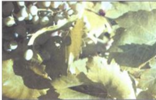
FIGURA 1 Folhagem com sintomas de deficiência em nitrogênio.