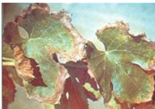
FIGURA 14 Sintoma de excesso de cloro: Necrose nas bordas das folhas

Pouco se sabe sobre as funções do cloro nas plantas, a não ser no crescimento e na fotólise da água. Em excesso, o cloro provoca toxidez, caracterizada por necrose das bordas das folhas (Figura 15) (CHRISTENSEN et al., 1978).