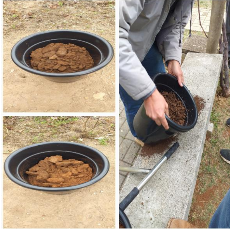
FIGURA 19 Amostras separadas em baldes e mistura

Durante esse processo as amostras foram misturadas em baldes, um para as amostras superficiais e outro para as subsuperficiais (Figura 20).