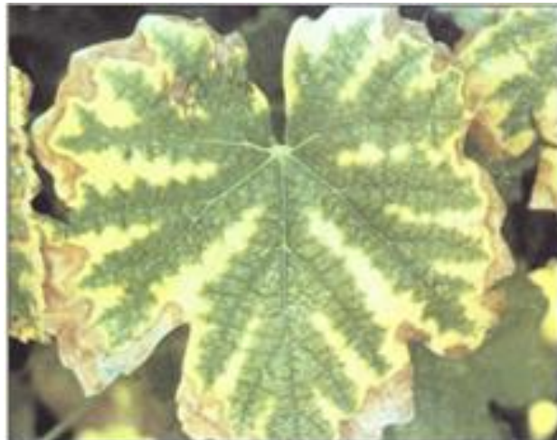
FIGURA 6 Sintoma de deficiência de magnésio: Clorose Inter nerval em estágio avançado