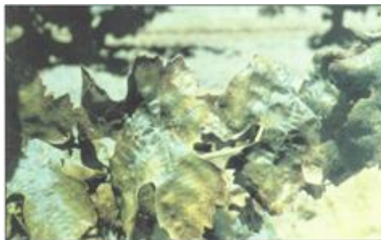
FIGURA 4 Sintoma de deficiência de potássio: Necrose