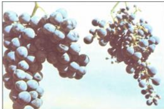
FIGURA 13 Sintoma de deficiência de zinco: Fruto sem sementes