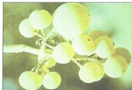
FIGURA 8 Sintoma de deficiência de boro: Morte do ápice vegetativo