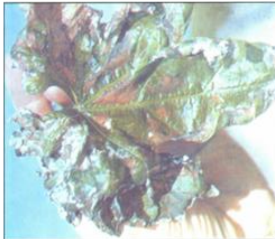
FIGURA 2 Sintomas de excesso de nitrogênio

A FIGURA 2, ao contrário, mostra sintomas de excesso de nitrogênio, com depósito de nitrato e necrose nas bordas da folha (CHRISTENSEN et al., 1978).