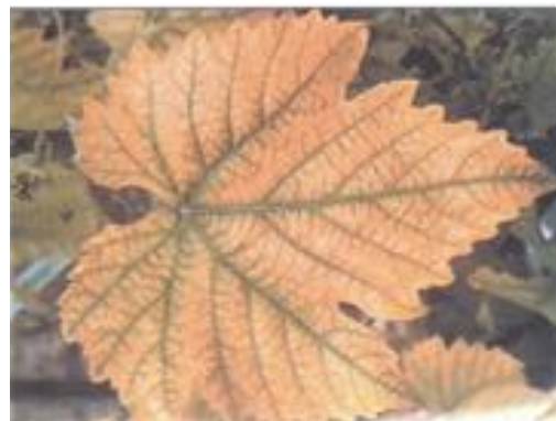
FIGURA 11 Sintoma de deficiência de ferro: Clorose Inter nerval