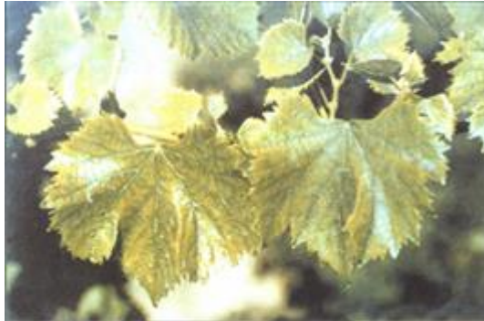
FIGURA 12 Sintoma de deficiência de zinco: Faixa verde nas nervuras