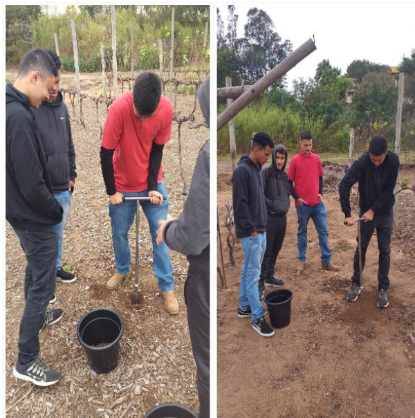
FIGURA 18 Grupo coletando amostras

Foram coletadas 20 amostras, 10 na profundidade de 0 a 20 cm, e 10 na profundidade de 20 a 40 cm (Figura 19).