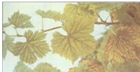
FIGURA 9 Sintoma de deficiência de boro: Amarelecimento