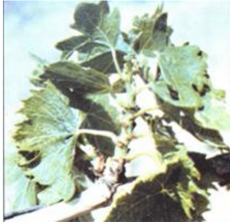
FIGURA 7 Sintoma de deficiência de boro: Diminuição dos internódios