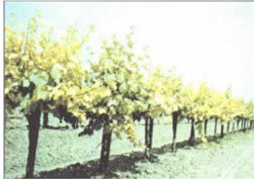
FIGURA 10 Sintoma de deficiência de ferro: Clorose Inter nerval

sintomas de deficiências surgem nas partes terminais com paralisação do crescimento. A deficiência aparece como uma clorose Inter nerval do limbo (Figuras 11 e 12), iniciando-se pelas folhas jovens, com sucessiva necrose da margem do limbo e queda das folhas (CHRISTENSEN et al., 1978; NOGUEIRA & FRÁGUAS, 1984).