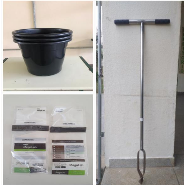
FIGURA 17 Materiais utilizados para a coleta das amostras