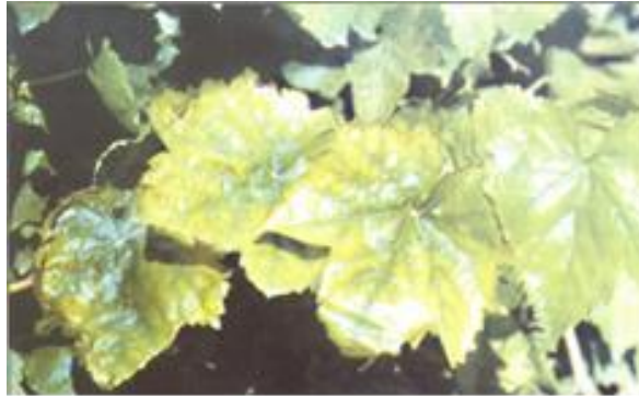
FIGURA 3 Sintoma de deficiência de potássio: Amarelecimento Inter nerval

fechamento de estômatos (TISDALE et al., 1985). Os sintomas da deficiência do potássio são observados primeiro nas folhas mais velhas, o amarelecimento Inter nerval e a necrose da zona periférica do limbo são os principais traços da falta desse nutriente (Figuras 4 e 5).