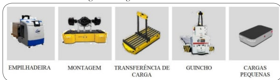
Figura 1 – Alguns modelos de AGV

Outro bom exemplo a ser citado é o Proteus, o primeiro robô móvel autônomo da Amazon, o mesmo é utilizado nos galpões da empresa para realizar a movimentação de carts de cargas, sendo altamente seguro para circular livremente ao lado dos funcionários, sendo assim esses robôs são construídos com tecnologia avançada de segurança, percepção e navegação (TECMUNDO, 2022). Na figura 1, modelos de AGV.