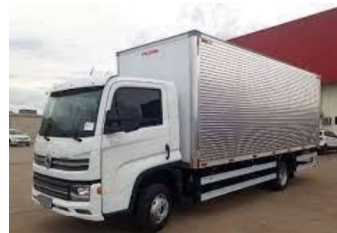
Figura 28 - Caminhão 3/4