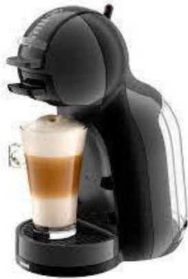
Figura 20 - Cafeteira