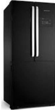
Figura 26 - Refrigerador