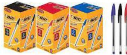
Figura 23 - Caixa de canetas