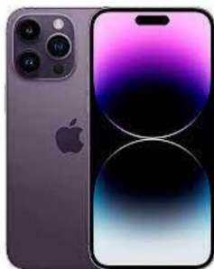
Figura 11 - Smartfone