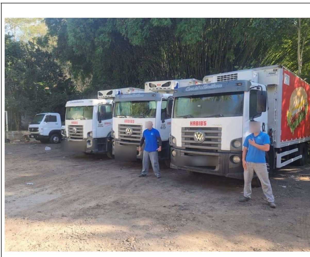
Figura 3 - Frota de funcionários

Todos equipados com Baú de fibra com equipamento de Refrigeração acoplados, para temperatura até -18°.