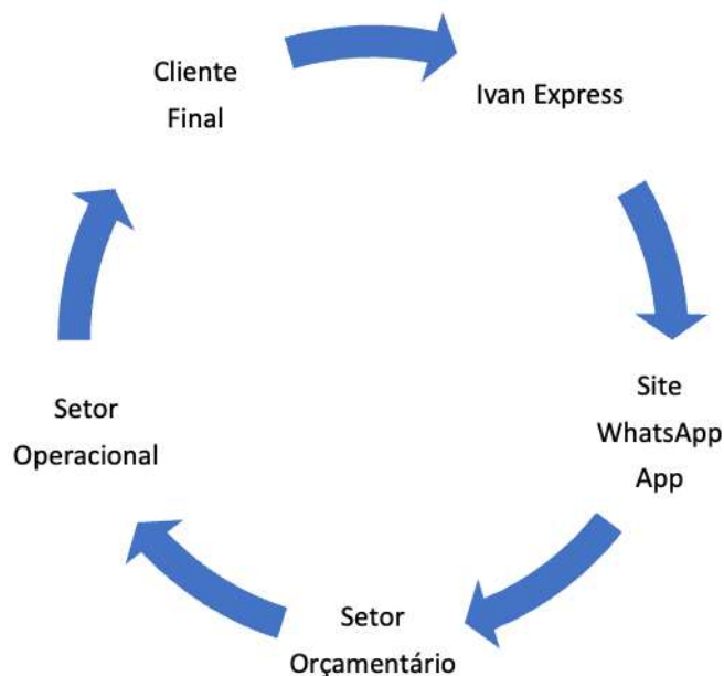
Figura 2 - Estrutura de comercialização