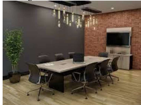
Figura 15 - Mesa de reunião