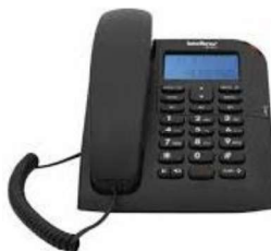
Figura 13 - Telefone