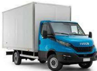
Figura 27 - Iveco