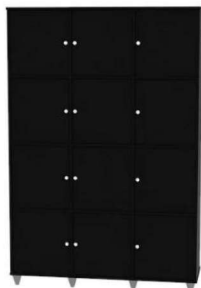
Figura 18 - Armário de banheiro