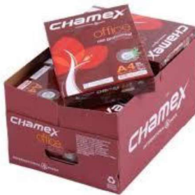
Figura 22 - Pacote de folha sulfite