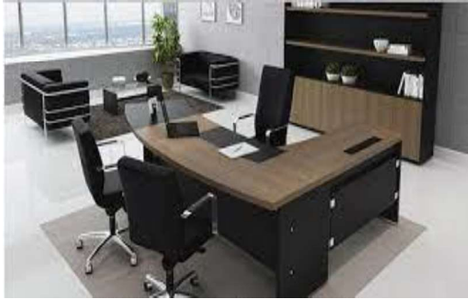
Figura 14 - Mesa de escritório