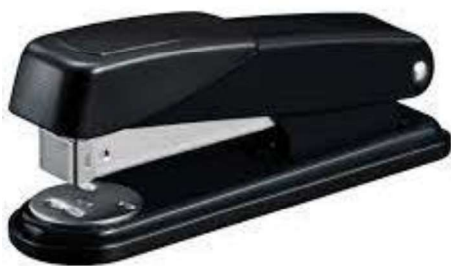
Figura 24 - Grampeador