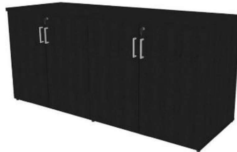
Figura 17 - Armário guarda volumes