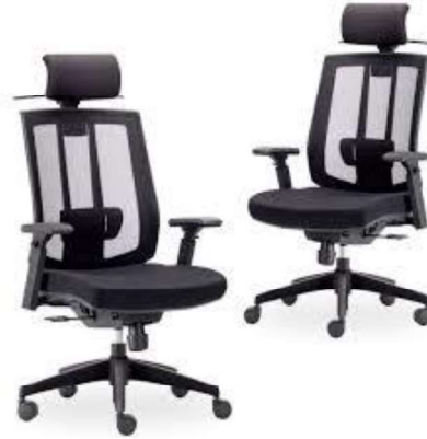
Figura 21 - Cadeiras ergonômicas