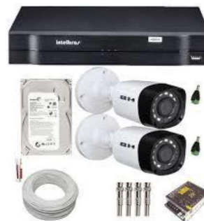
Figura 12 - Sistema de monitoramento