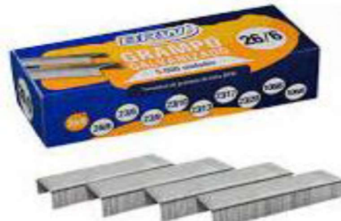
Figura 25 - Grampos