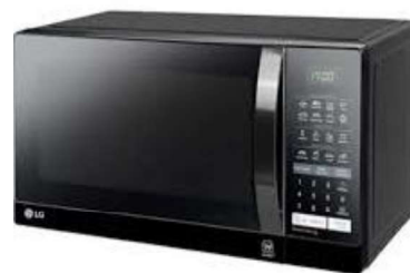
Figura 19 - Microondas