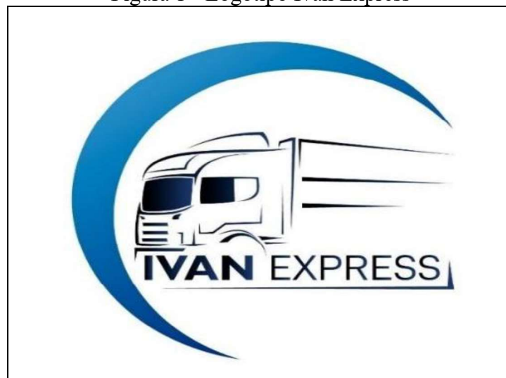
Figura 1 - Logotipo Ivan Express

Após um ano e meio em ação, a empresa passou por altos e baixos devido à maior crise sanitária causada pelo COVID-19, na qual alguns de seus parceiros foram obrigados a cumprir as exigências impostas pelo governo e fechar as portas, levando a uma oscilação na demanda prestada. Porém, atualmente, a empresa se encontra em uma melhoria contínua por conta da procura de novos parceiros.