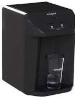
Figura 16 - Purificador de água