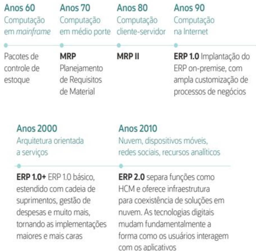
Figura 1: Evolução do ERP.