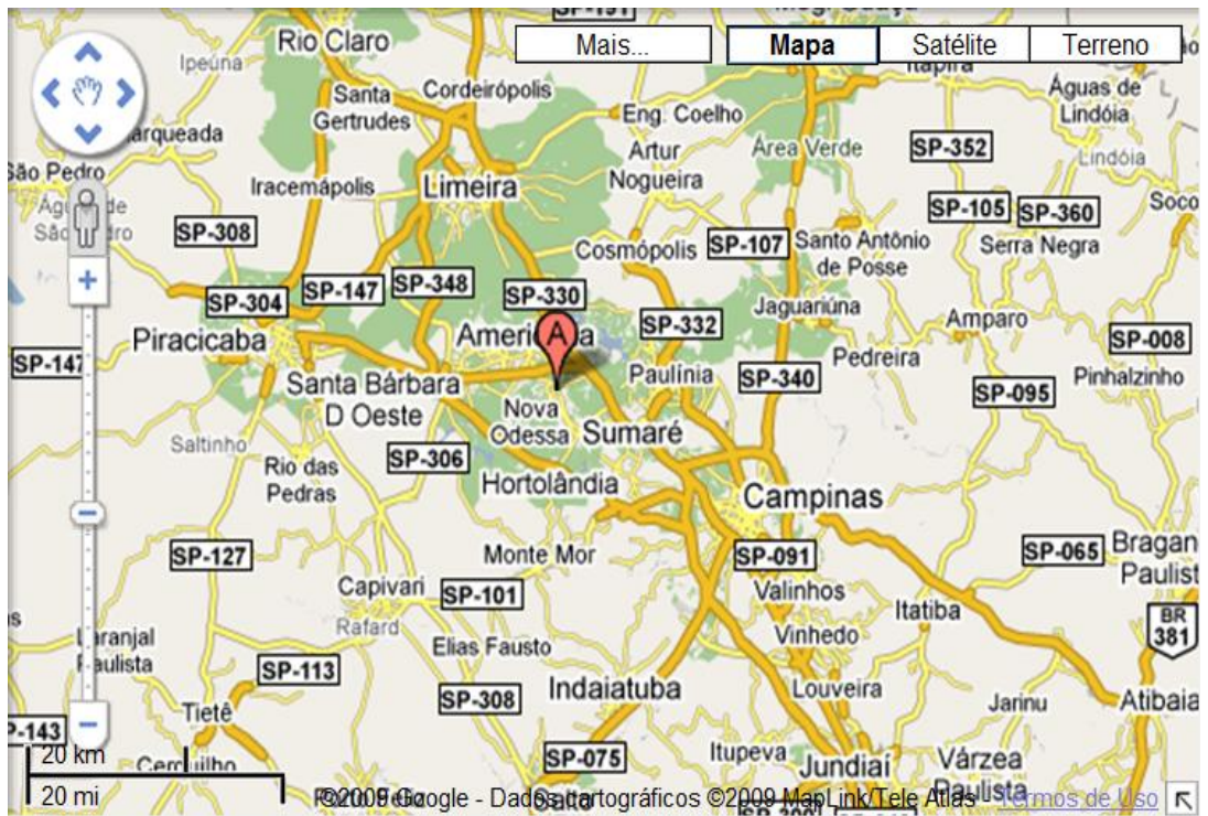
Figura 1: Mapa da malha viária Metropolitana de Campinas (Google Maps)