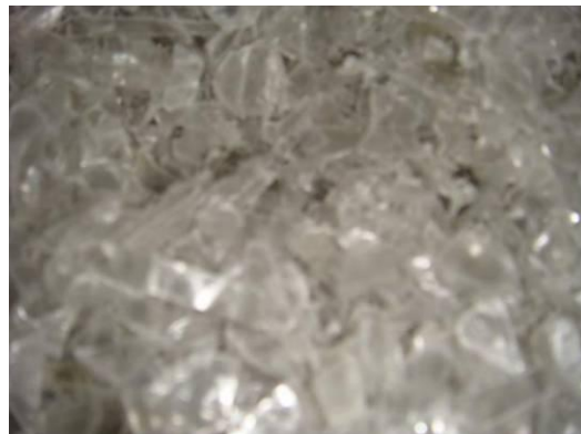
Figura 4: Flakes