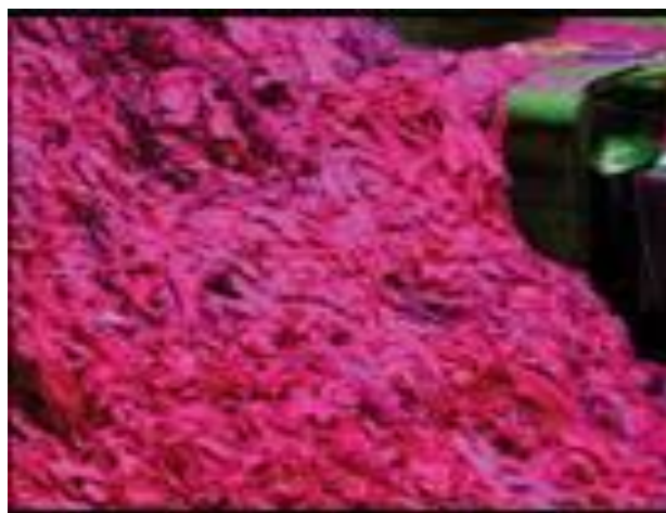
Figura 8: Transformação do tecidos e fibra