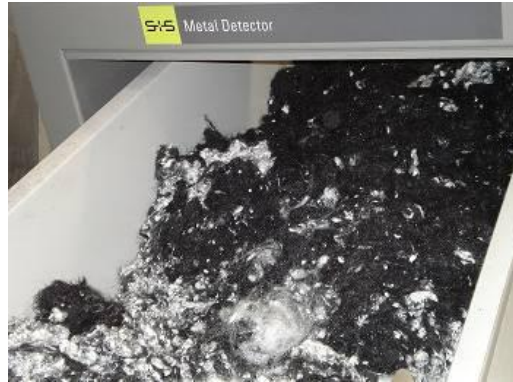
Figura 5: Alimentação de maquina