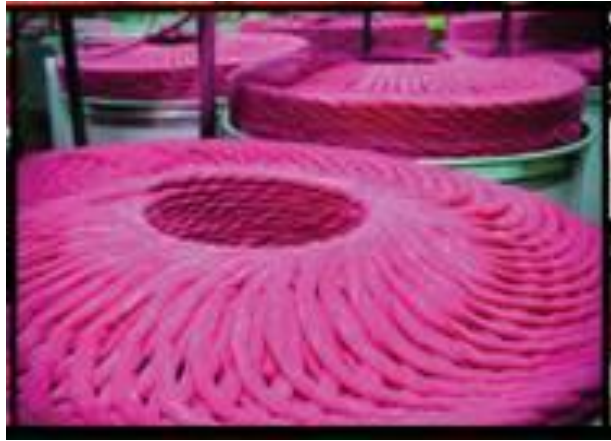
Figura 9: Fitas de carda