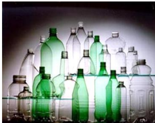
Figura 3: Garrafas de PET