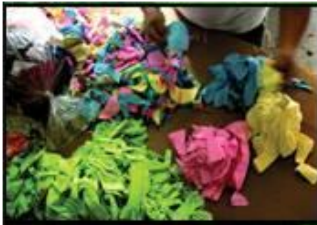
Figura 7: Separação do tecido por cor

Para cada 1 kg de fio produzido com algodão desfibrado deixamos de jogar no meio ambiente 640g de agrotóxicos.