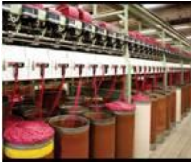
Figura 10: Filatorio Open-End

Fornecedores de fio 100% Algodão Desfibrado Ne 8/1;