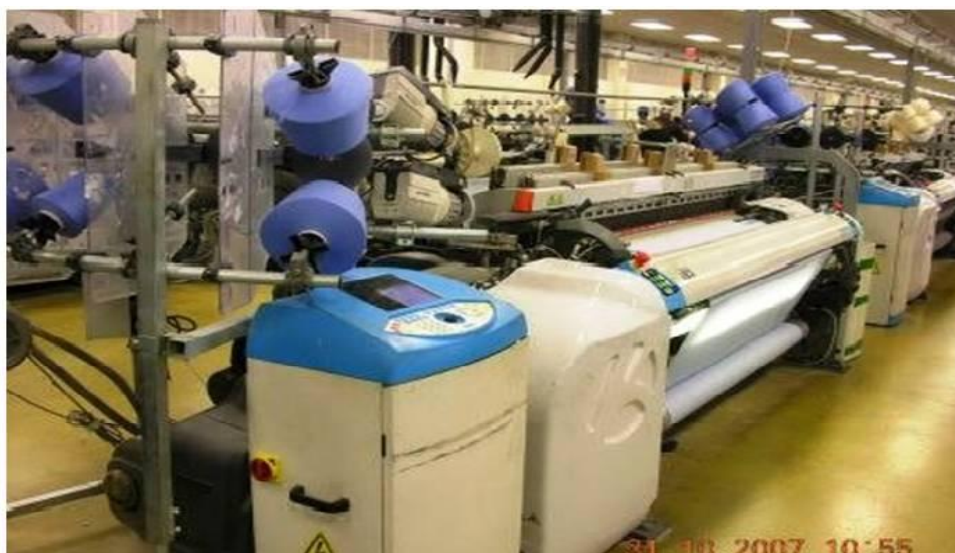
Figura 11: Tear Vamatex-Leonardo