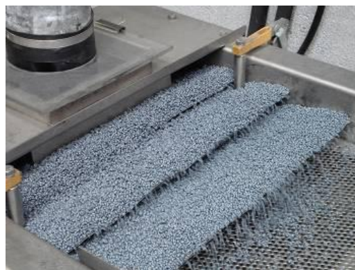
Figura 6: Chip de PET