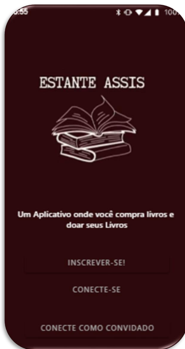
Figura 2 – Aplicativo