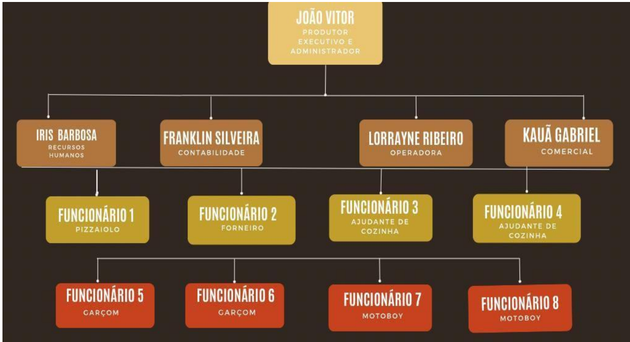
SEQ Figura \* ROMAN III. Figura: Equipe geral da empresa