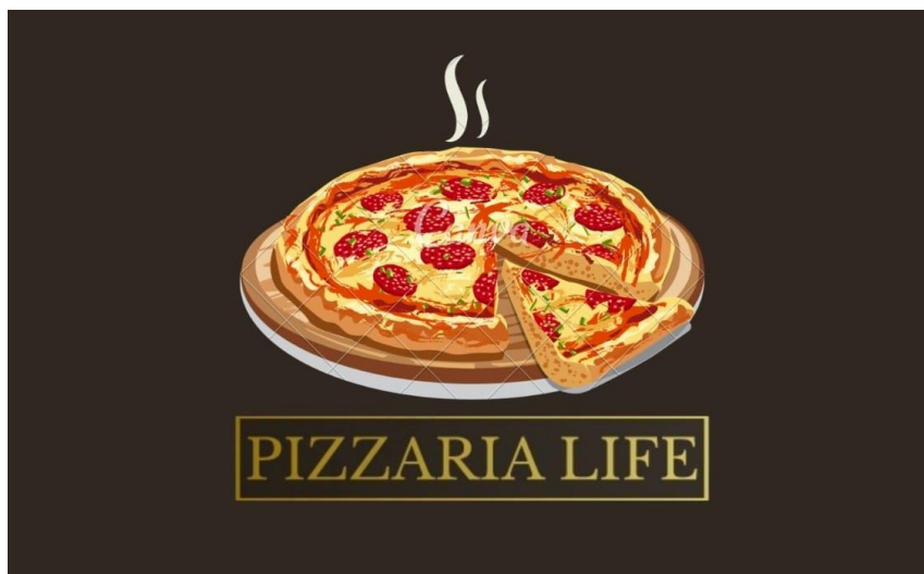
SEQ Figura \* ROMAN I. Figura: LOGO da Pizzaria Life

O nome do negócio é “Pizzaria Life” que especifica o ramo, segmento e principal objetivo da empresa, LIFE que traduzida significa VIDA. Queremos oferecer para o cliente, uma vida melhor, saudável e de qualidade onde ele não precisará renunciar a um alimento tão saboroso, para manter o padrão de uma vida saudável. Focado no ramo fitness para aliar sabor e saúde, é uma microempresa voltada para pizzas de altas qualidades.