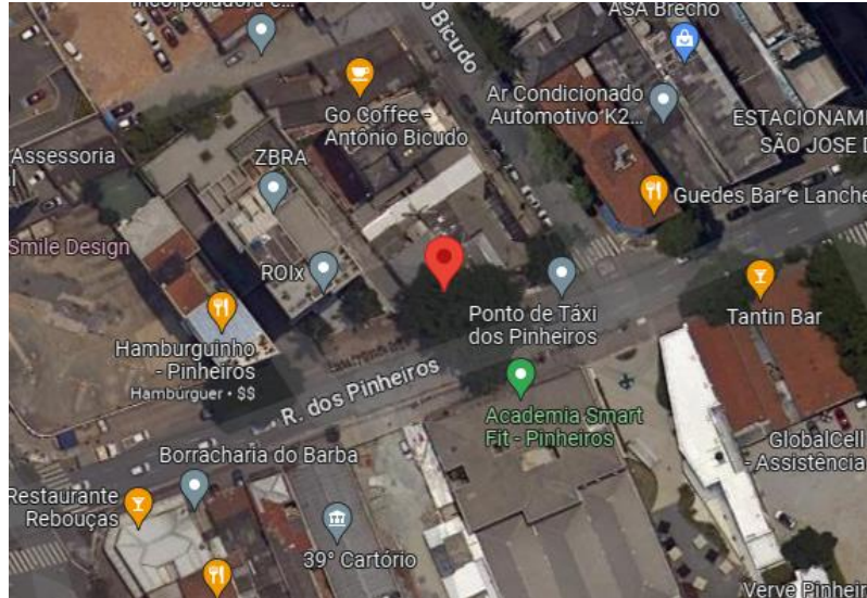
SEQ Figura \ * ROMAN II. Figura: Localização da Pizzaria Life