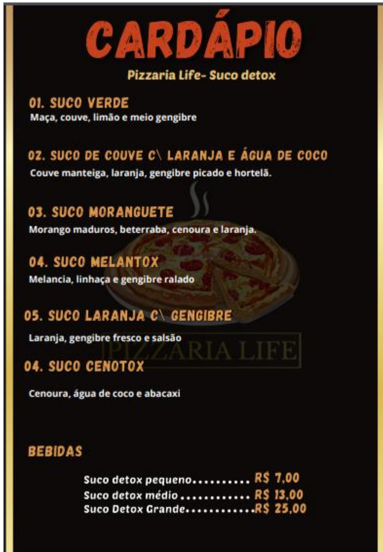
SEQ Figura \* ROMAN VIII Figura: parte 4 do cardápio