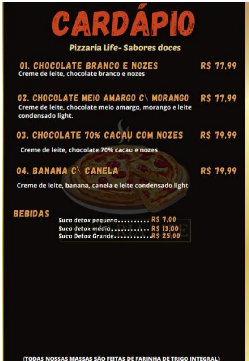
SEQ Figura \* ROMAN VII. Figura: parte 3 do cardápio