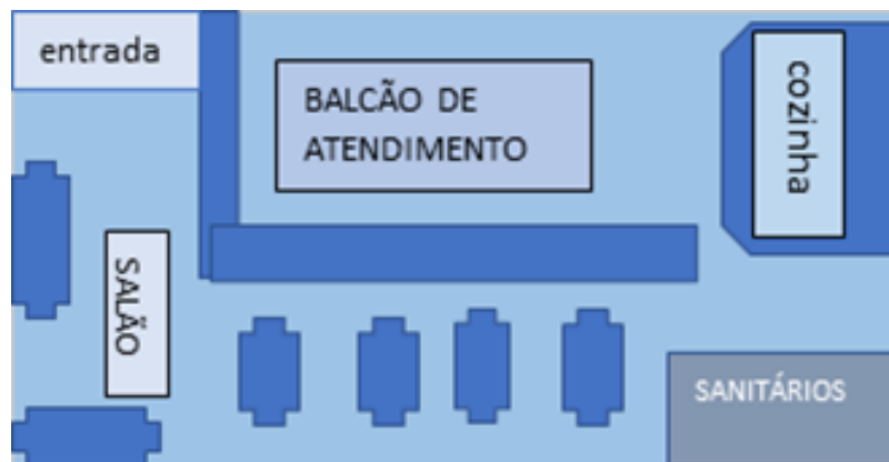
Figura SEQ Figura \* ROMAN XIII: Layout do estabelecimento

O layout da empresa abrange a forma que será o estabelecimento através de uma planta feita pelos sócios. “Um layout irá refletir nos passos mais importantes, dados pela empresa, oferecendo vantagens e benefícios para a empresa, ao englobar a aparência no espaço físico, trazer melhorias operacionais e melhorar o desempenho dos funcionários.” (ANTONIOLLI).