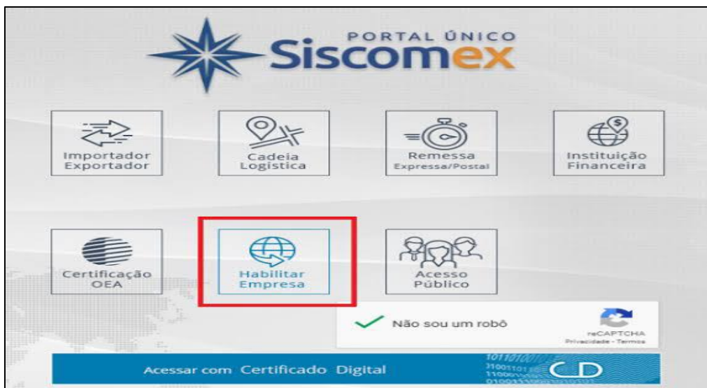
Figura 2- Página inicial do sistema Siscomex.

Após verificarmos qual o cliente se encaixa, precisaremos acessar o Portal Único Siscomex e escolher a opção Habilitar Empresa, como na imagem a seguir: