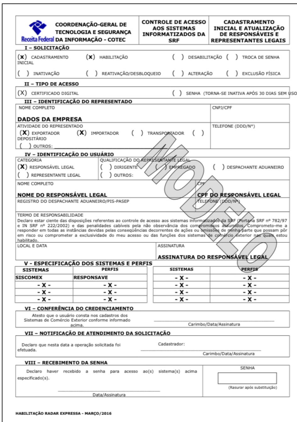
Figura 7- Solicitação dos dados.