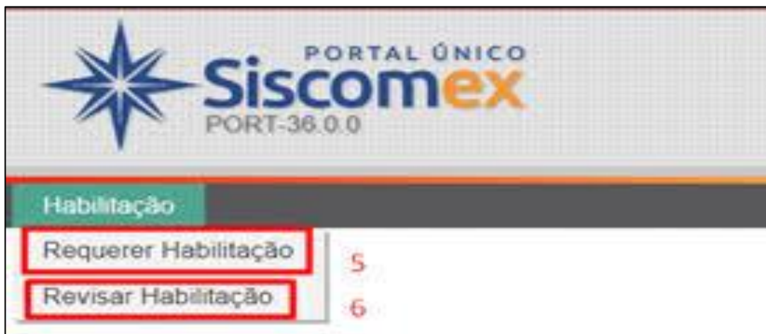
Figura 3- Requerimento da Habilitação do Siscomex.