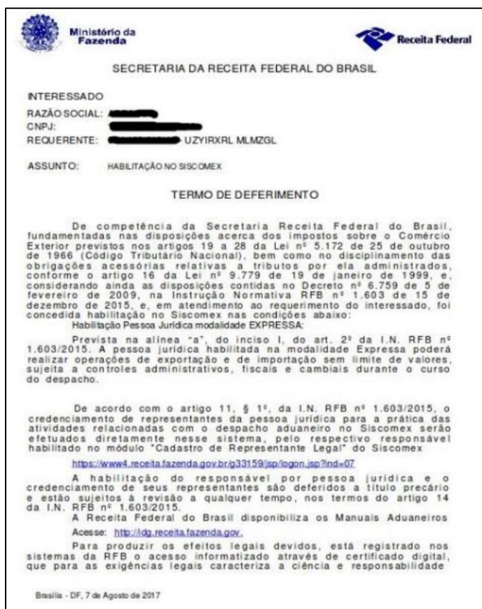
Figura 6- Termo de deferimento.