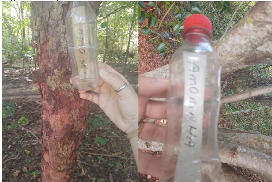
Figura 3 – Espécies florestais com sua devida identificação

preservação e acesso, caracteriza-se por um ambiente fresco, com muita sombra e com grande potencial de receber visitantes, seja para o turismo pedagógico ou simplesmente para contemplação (Figura 4).