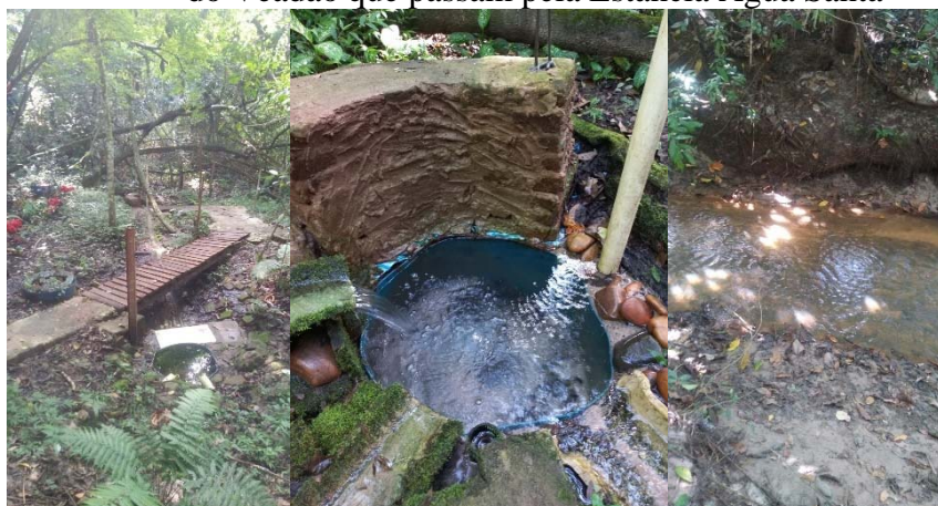
Figura 4 – Área de preservação permanente, nascente e Córrego do Veadão que passam pela Estância Água Santa

O proprietário não realizou nenhum tipo de análise que ateste as propriedades ou qualidade da água do córrego ou da nascente. Visualmente ela parece pura. Também não apresenta cheiro ou gosto. Contudo, sugere-se que que faça essa análise, pois apenas a cor, sabor e cheiro não são suficientes para afirmar se uma água é potável ou adequada para o consumo.