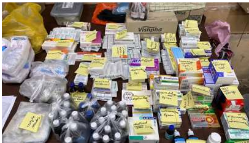
Figura 3: Medicamentos enviados por motoristas voluntários para a linha de frente na Ucrânia.

A União Europeia auxiliou a Ucrânia a realizar a logística da cadeia de suprimentos dos medicamentos antirretrovirais entregues no país, que necessitou de diversos esforços. Para tal ato, a EU, inicialmente, organizou-se com o Serviço Ferroviário da Ucrânia a coleta dos lotes em uma estação distante do principal ponto de entrega da maior parte da Ajuda Humanitária, visando não ocorrer ataques às cargas e conseguir gerenciar a distribuição do material para as regiões mais necessitadas. A OCHA (2022) destacou que "A parte mais difícil e mais importante do processo é a entrega em toda a Ucrânia, incluindo as zonas da linha de frente.", contudo, por causa da guerra, diversas empresas logísticas fecharam ou se negam a entregar mercadorias em regiões onde o conflito está mais intenso. Nesta parte logística, o país tem apenas o apoio dos motoristas voluntários, que em coordenação com as autoridades locais, dirigem até as áreas necessitadas e ajudam a evacuar pessoas e entregar medicamentos e outros bens, como pode ser observado na Figura 3, um carregamento de medicamentos direcionado a áreas do conflito.