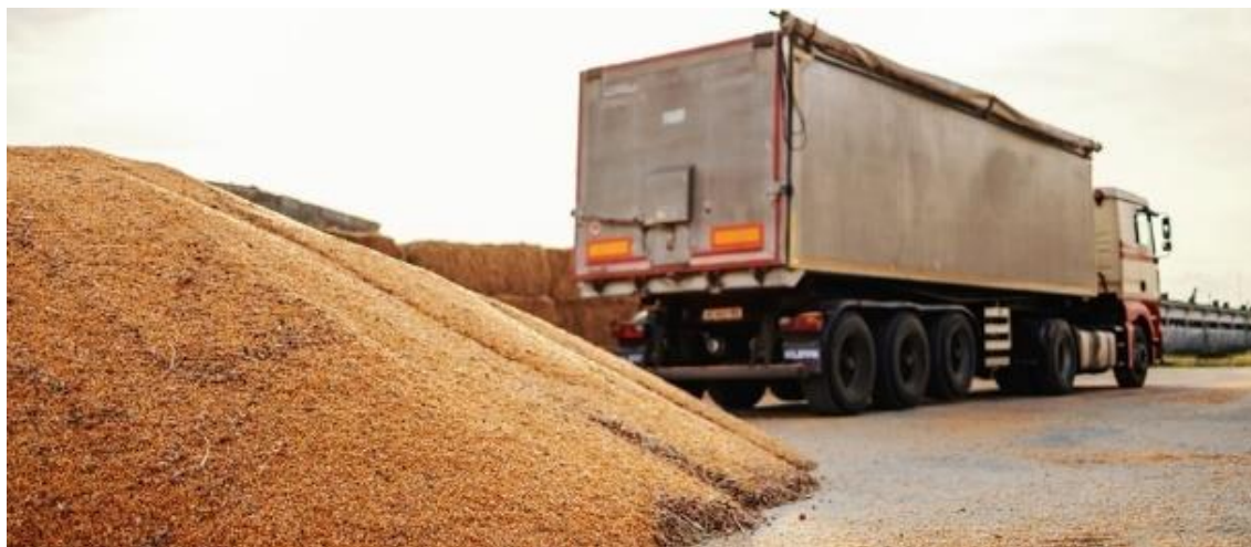
Figura: 1 – Carga granel

Para este tipo de mercadoria, incluindo grãos, cascalhos e até mesmo alguns líquidos, caminhões, reboques e graneleiros são comumente usados.