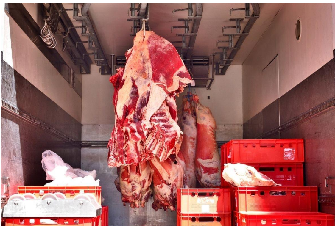
Figura 2 – Carga frigorífica

A carga frigorífica também chamada de refrigerada, está entre os tipos de mercadorias que podem ser perecíveis ou congeladas, e que requerem cuidados especiais para o seu transporte. Afinal, sem embalagem adequada elas são propensas à deterioração. Bens perecíveis, como frutas e legumes, não podem ser embarcados por longas distâncias para evitar os riscos mencionados acima. Além disso, é obrigatório que o veículo que transporta a carga seja forrado com câmara frigorífica ou equipamento de refrigeração, por isso o refrigerador costuma ser o mais utilizado. Esta caixa está equipada com um dispositivo que permite manter a temperatura entre 0 e -10 ° C, sem a formação de gelo, sendo o meio de transporte rodoviário mais comum para o transporte de mercadorias frigoríficas.