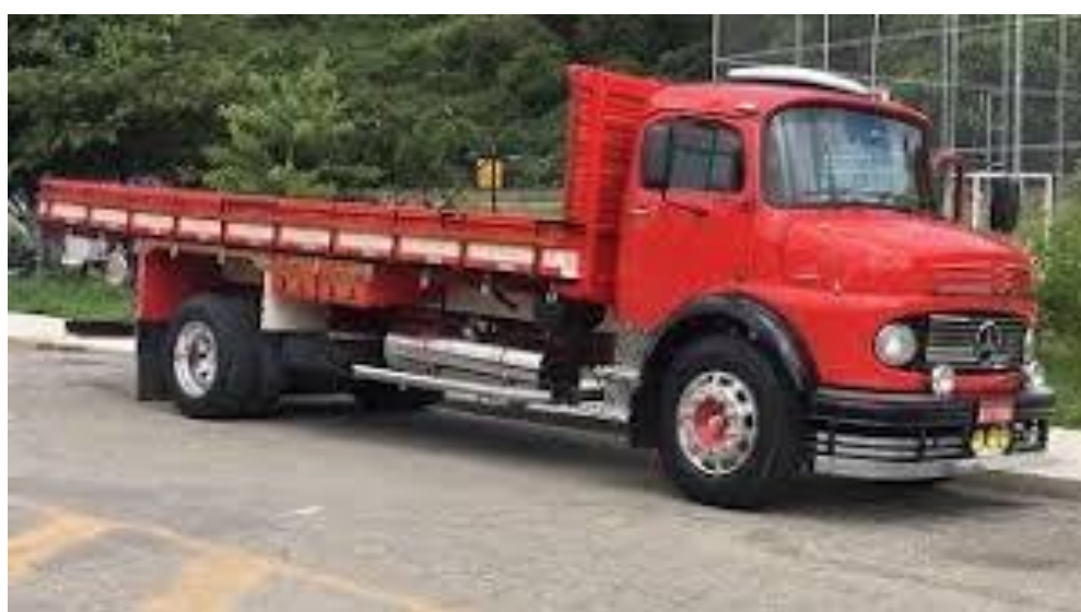
Figura 7 – Caminhão toco

O caminhão toco possui dois eixos, capacidade máxima de carga de 6.000 kg e PBT de 16 toneladas. Os cascos mais comuns para este veículo são Chest e Low Grade. Toco é usado para transportar produtos de entrega ou produtos secos, como feijão, açúcar, óleo, etc.