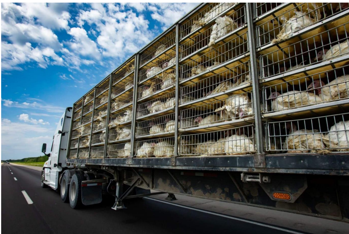
Figura 3 – Carga Viva

No caso de mercadorias vivas, o principal ponto de atenção que o transportador deve ter é garantir o bem-estar dos animais, por isso é necessário o uso de carrocerias fechadas, como cabeços, com vários pontos de ventilação para garantir o fluxo de ar adequado.