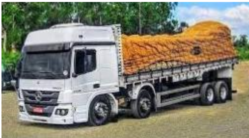
Figura 10 – Bitruck

Por ter quatro eixos, o Bitruck tem maior capacidade de peso (até 22.000 kg), com PBT de 29 toneladas. Portanto, carrega cargas mais pesadas e maior desempenho. É um veículo muito utilizado para transporte de carga seca, mas também atende bem outras operações logísticas do mercado.